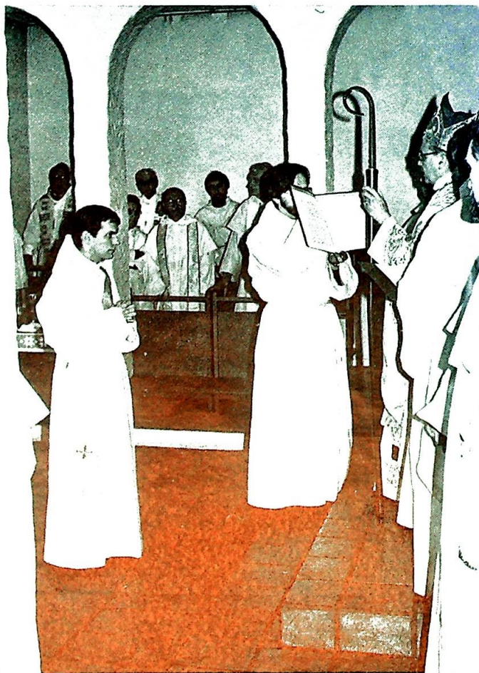
Ja, det lover jeg!