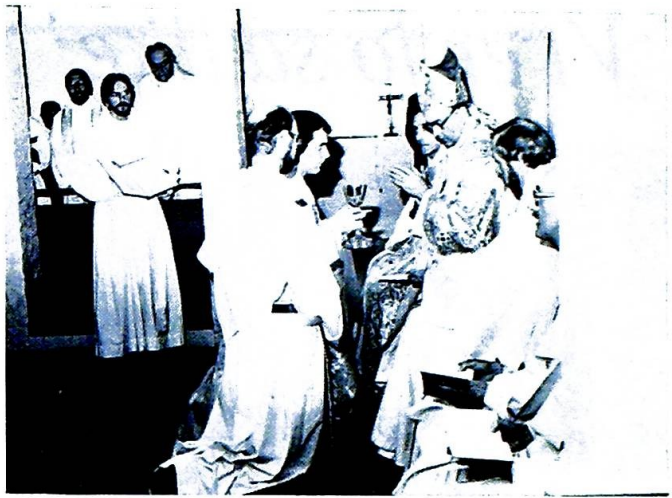
En frukt av vintreet og av menneskers arbeide.

— I denne pluralismens tid varierer det sterkt fra provins til provins, og man tar dessuten i langt høyere grad enn før hensyn til individuelle forskjeller og ønsker. Målet er å gi den enkelte mulighet til å utvikle maksimalt sine evner og anlegg. Dog finnes det en viss struktur som respekteres overallt: Etter et års prøvetid (novisiatet) følger minst et par år med filosofiske studier, hvor det samtidig gis innføring i Den hellige skrift og andre teologiske disipliner. De som har en universitetseksamen før de trer inn i ordenen får ofte bruke denne tiden til å arbeide videre med problemer som opptar dem. For alle gjelder det at de i løpet av disse første årene bør sette seg inn i de klassiske språk, latin og