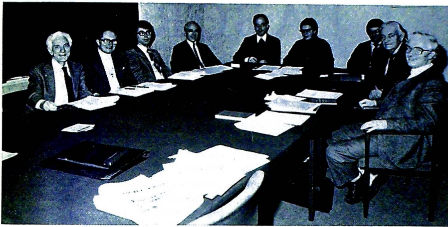
Etter fire hundre år kan lutheranere og katolikker sitte ved samme bord og i all fordragelighet klarlegge forskjeller og felles problemer.

Som bekjent er det nedsatt et utvalg av både romersk katolske og lutherske teologer og geistlige med den oppgave å innlede en teologisk samtale. En slik teolog-gruppe finnes i de fleste land, hvor disse to kirkesamfunn er representert. Man ser på sin oppgave med det dypeste alvor, ikke minst ut i fra den erkjennelse at man har den samme rot og det samme mål. Spørsmålet er så bare, hvordan man sammen kan nå dette mål, når de mellomliggende årsaksforhold er så forskjellige, som de i virkeligheten er. Det er nemlig også et interessant moment som man oppdager, når man med ærlighet og oppriktighet går til den oppgave som heter økumeniske samtaler om teologiske spørsmål.