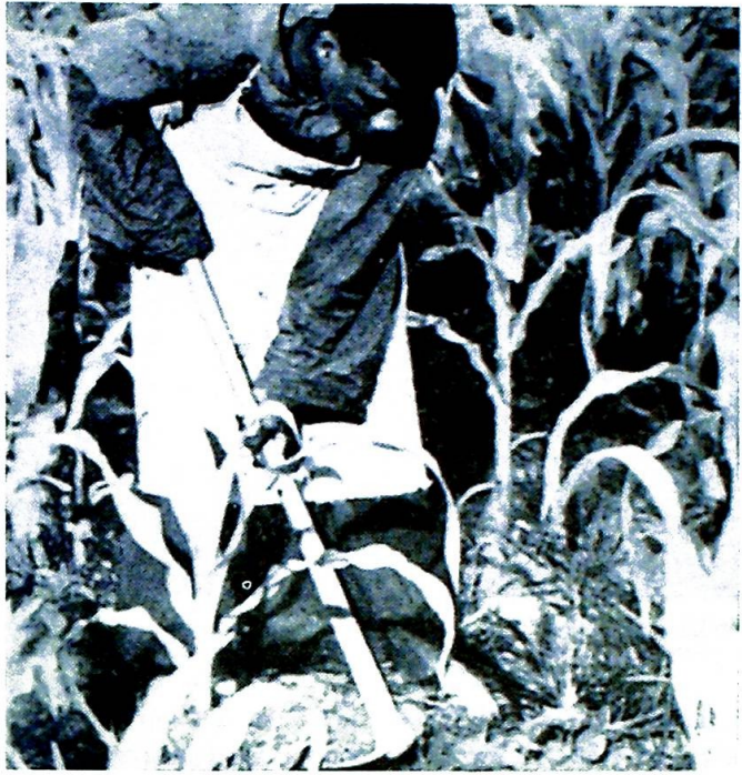
LABORA. — Arbeidet spiller en vesentlig rolle for benediktiner munkene i hvilken verdensdel de enn har deres klostre.

Benediktinerne så tydelig, at det ikke gikk an å skape en «orden» med ensar-