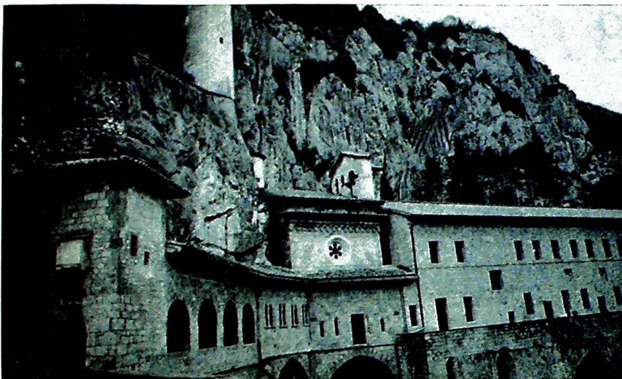
St. Benediktsklostret i Subiaco, hvor det den dag i dag bor ti eneboer-munker, riktignok tilsluttet St. Scholastica klostret ved fjellets fot.