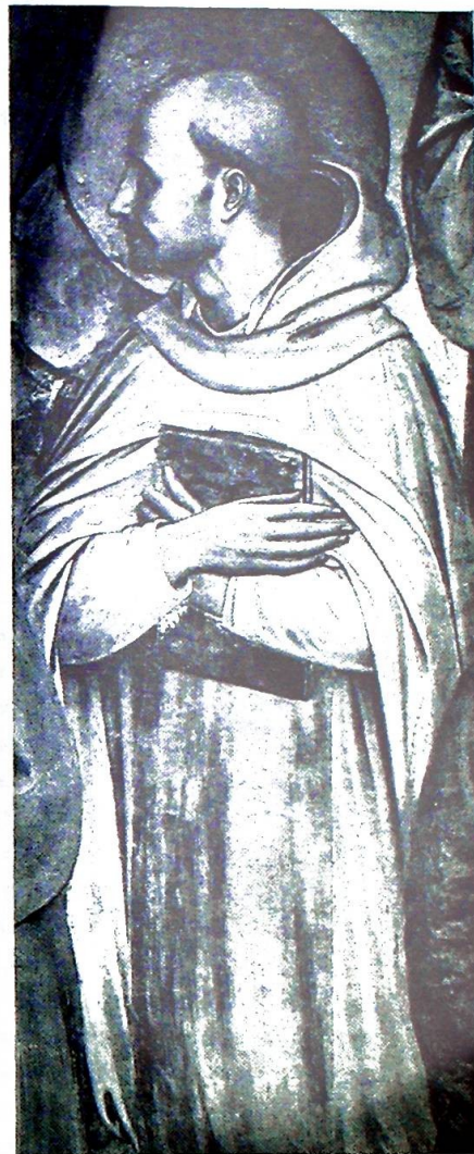
Den hellige Bernhard.

veier Gud har gitt til salig liv: fornuften og dens studium av de menneskelige ting, troen og dens studium av de åndelige ting.