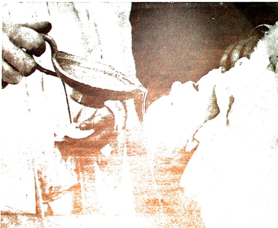
Helt fra Kirkens begynnelse har det vært ansett som normalt at barna i de kristne familier ble døpt mens de var små.

Hvordan presenterte katekumenatet seg for dem som ble godtatt? Reglementet er kort, men klart. Katekumenatet varte tre år. Vi vet at disse årene opprinnelig ikke ble betraktet som en undervisning i tros- lære, men mer som en moralsk prøvetid, — et slags novisiat med både fromhetsøvelser og passende under-