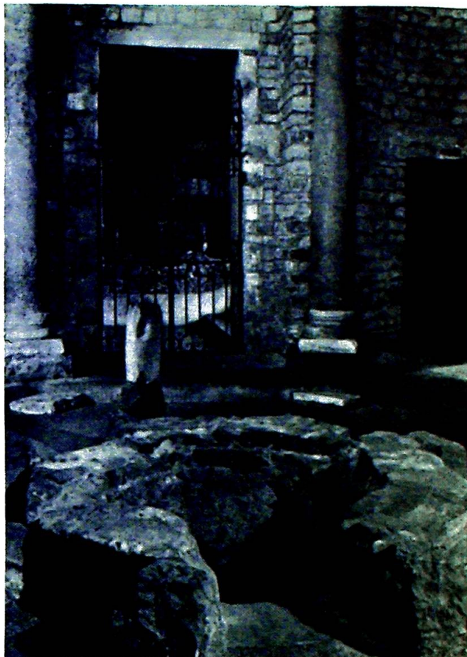
Dåpen skjedde ved neddykking.

er faktisk den eldste romerske katekese redigert med tanke på dem. Noen dager før dåpen skulle den resiteres for biskopen.