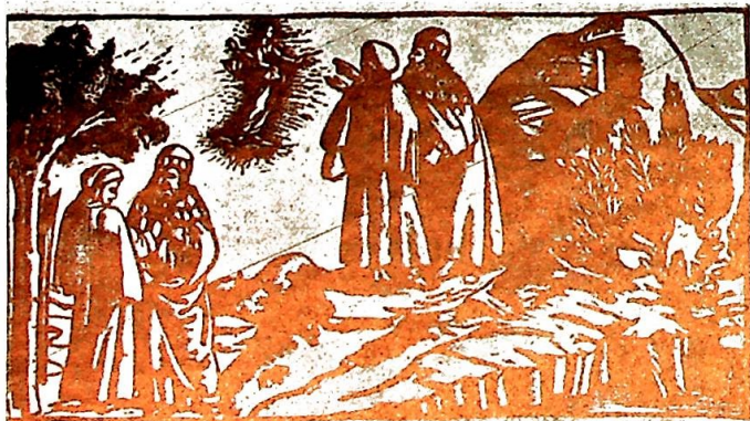
Hentet fra den første illustrerte utgave av «Den guddommelige komedie».

Denne pilegrimstanke henger sammen med forestillingen at Kirken — forstått som Kristus i verden — er selve Veien . I middelalderkunsten blir denne forestilling ofte uttrykt i bildet av et skip, metafor for Kirken som fører de kristne sjeler trygt i havn i paradiset: det er representanter for de forskjellige munkeordener og prelater som ror båten med dens sjelelast inn i himmelens havn. Båtens mast symboliserer krusifikset.