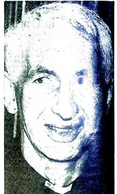
Kardinal Hume, erkebiskop av Westminster.

Et av de spørsmål som ble reist på konferansen angikk ordinasjon av kvinner. Om kvelden den første møtedagen kom kardinal Hume, erkebiskop av Westminster, med en advarsel: Hvis konferansen avsa kjennelse i favør av ordinasjon av kvinner, kunne den økumeniske bevegelse få et tilbakeslag. Som grunn anga han at det ville forårsake splittelse innen det anglikanske fellesskap, noe som igjen ville vanskeliggjøre samtaler med Den katolske kirke. Da emnet så ble tatt opp, inngikk man et typisk engelsk kompromiss: Man overlot hvert medlem av det anglikanske fellesskap å ta sin egen beslutning. De Forente Stater hadde allerede sine kvinnelige prester. Ved et møte senere på året stemte The Church of England mot kvinnelige prester.