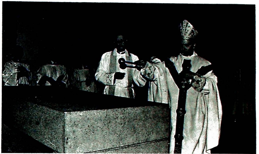
Biskopen innvier en kirke.

Å tolke Guds ord er vanskelig. At individuell tolkning av Guds ord lett fører vill, innså de kristne tidlig (2. Pet. 1, 20; 3, 16). Derfor ble den felleskristne tro det mål som skulle brukes for å fastslå om noe var Guds ord eller ikke. På bl.a. det grunnlag ble det fastslått hvilke skrifter som skulle være med i Det nye testamentet. Den felleskristne tro har siden vært målestokk for hvordan Guds ord skal forkynnes rett.