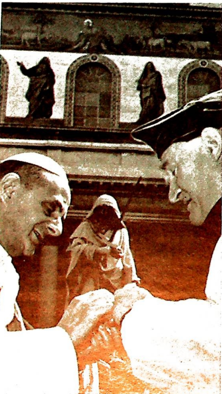
Sinnbildet på en pave som sprengte den katolske kirkes selvvalgte isolasjon.

Ikke så med Pave Paul. Knappt hadde vi fått den uventede meddelelse om hans hjerteinfarkt sist søndag, så kom meldingen om at livet var ebbet ut. Det var kanhende noe symbolsk i dette. Verden og Pave Johannes hadde funnet hverandre — for å si det slik — på en måte som neppe var tilfelle med Paul VI, selv om denne innehadde ledelsen av Kirken tre ganger så lenge. Jeg tror ikke bare at vår Herre ønsket den dengang relativt ukjente patriark av Venezia, Roncalli, på pavestolen,