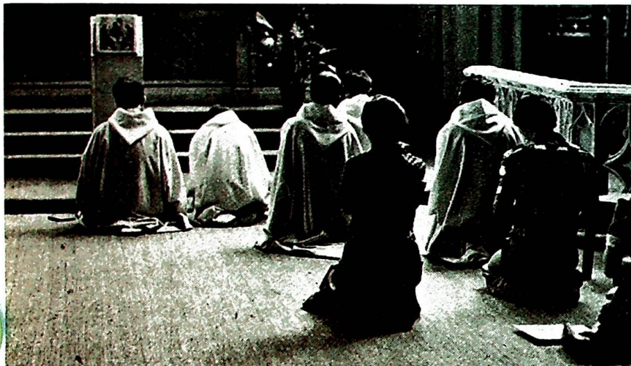
«By-munker» i Saint Gervais.

— «Se deg om i strøket: Bakerne er flyttet! Så du ser at det nesten ikke bor folk her — pariserne kan ikke leve uten en baker på hjørnet.»