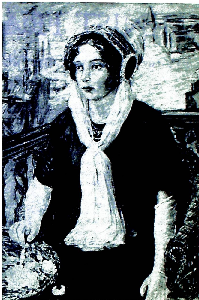
Sigrid Undset: Motsetning mellom behovet for frigjøring på den ene siden og forsvaret for den «gamle» kvinneverolen på den annen.