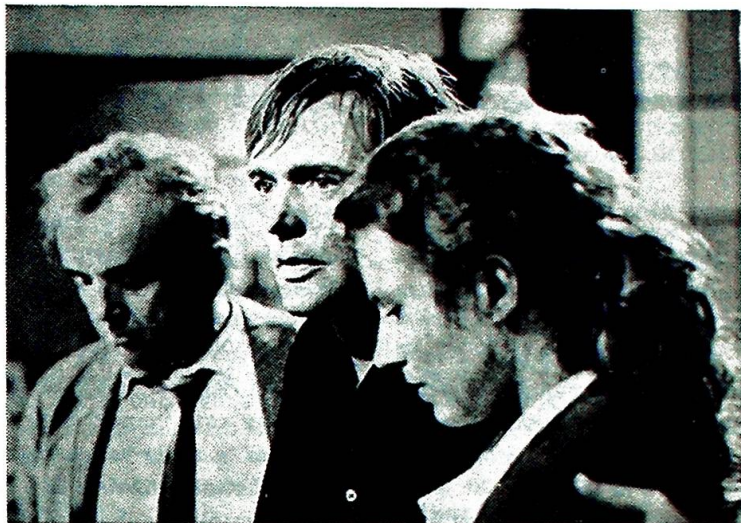
EN KLOVNS BETRAKTNINGER