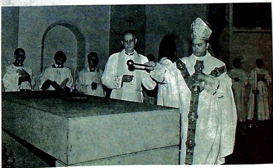
Biskopen vigslar det nye alter.