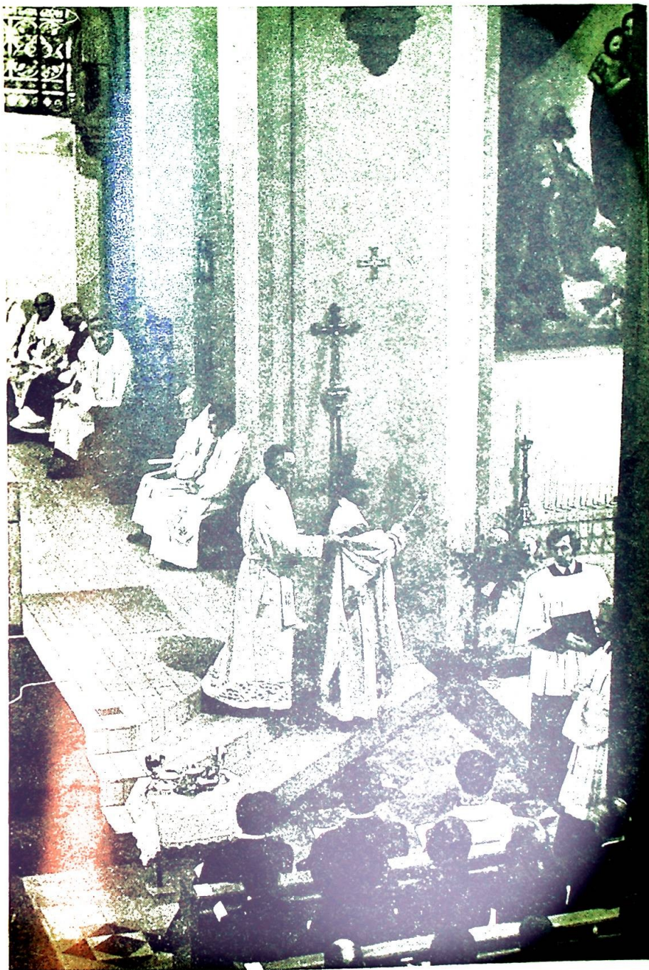
DOMKIRKENS DAG - Side 290 - 294

En ordenssøster skriver om dagens jag, mas og -