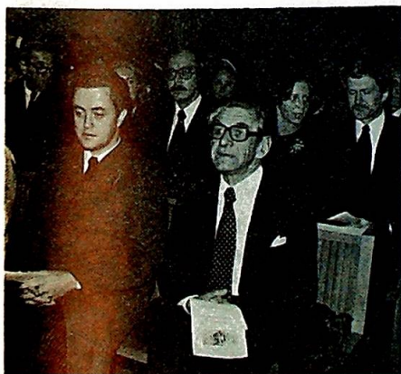
Statsråd Kjølve Egeland (til h.) og stortingsmann Lars Roar Langset.