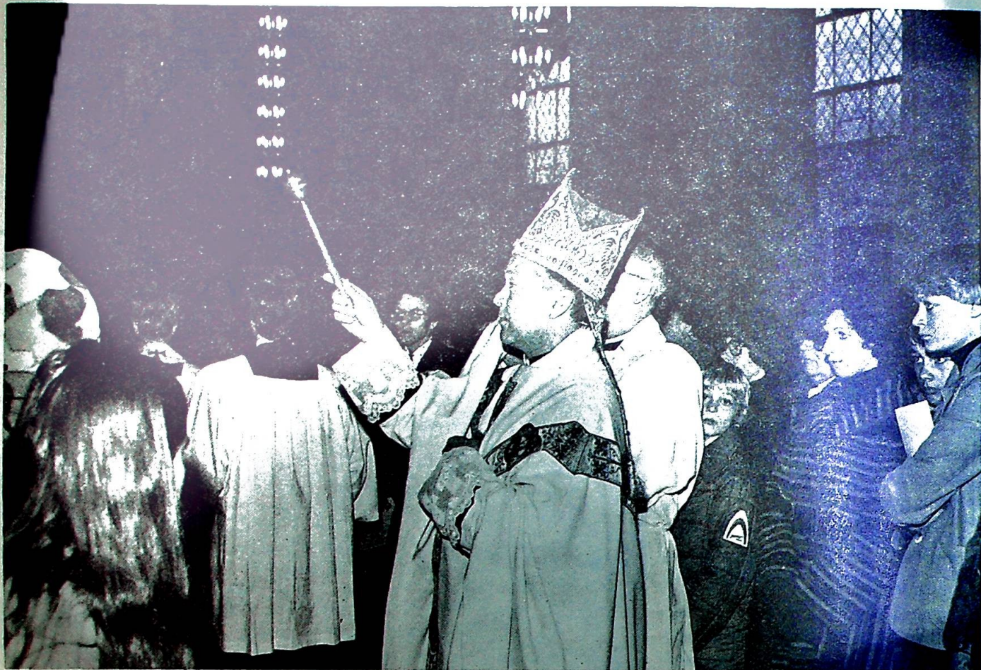
Kirken vigles under den høytidelige prosesjon.