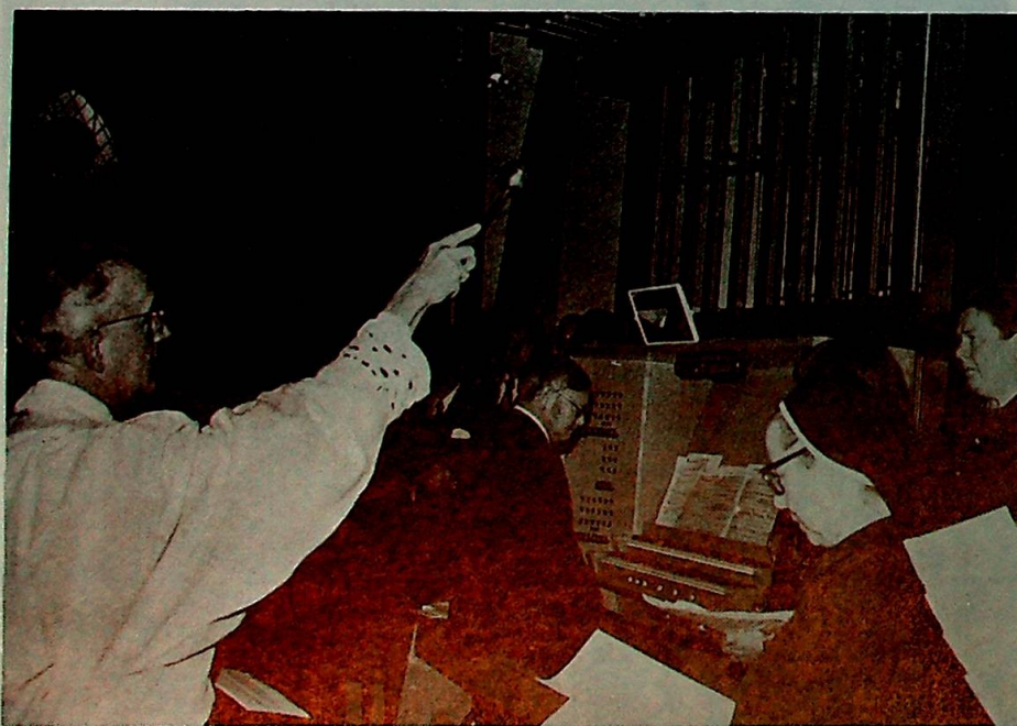
Det nye orgelet vigles.

For vi mennesker er svake og trenger til hverandre. Vi trenger å støtte opp om hverandres bønn, trenger fel-