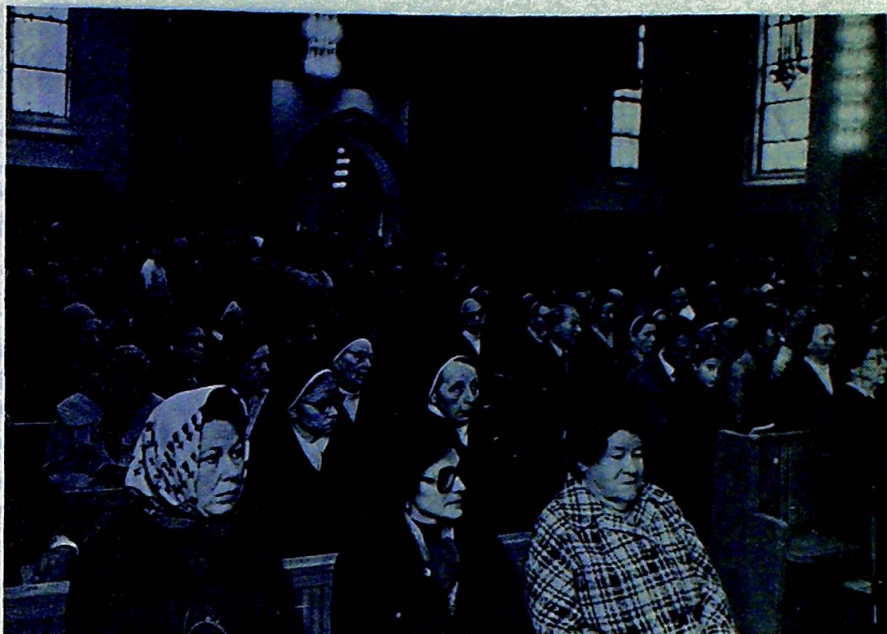
En fullsatt kirke.

Og i dette samfunn står kirkene der, ragende opp likesom en velsignelse over landskap og bybilde, men også manende og minnende oss om,