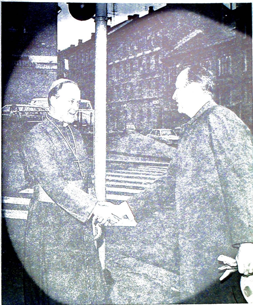
Biskopen mottar kronprins Harald utenfor kirken.

I sannhet en utfordrende tekst i sammenheng med innvielsen av et kirkebygg! Over hele Norges land, ja, over store deler av verden, strever jo kirkesamfunnene med å reise og vedlikeholde og restaurere Gudshus for Ham som har uttalt disse ord. Har da hans disipler i alle slektledd — vårt eget ikke unntatt — forrådt hans grunnsyn, når vi reiser kapeller, kirker, katedraler til hans ære? Ved en annen anledning siterte han jo Gudsordet i det Gamle Testamente: «Barmhjertighet, ikke ofringer er det jeg vil ha!» (Mt. 12,7). Ånd, sannhet, barmhjertighet er det altså Jesus krever av oss. Dersom vi et øyeblikk