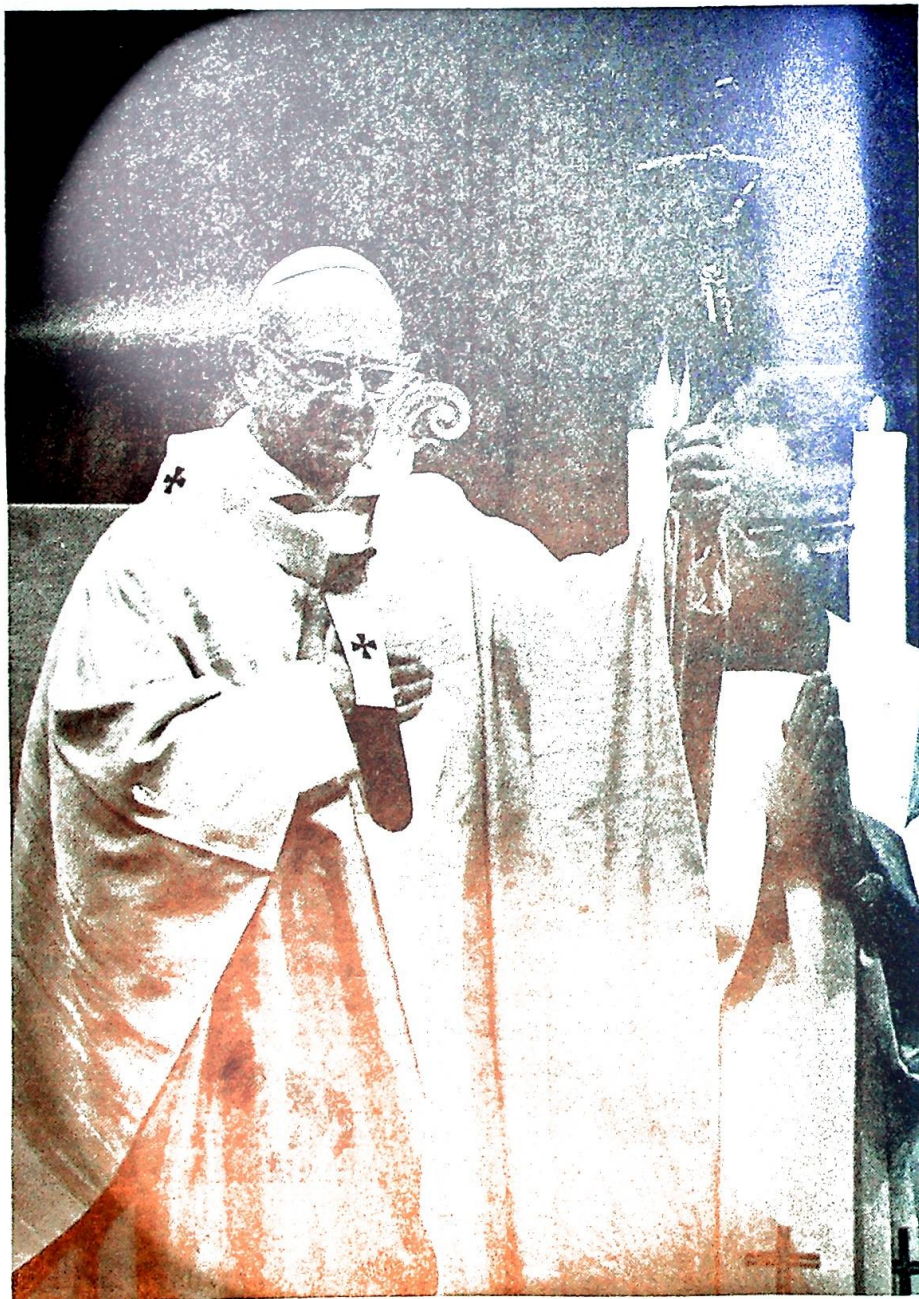
Pave Paul VI under feiringen av messen i Peterskirken på Den internasjonale Fredsdagen.

ST. OLAV KOSTER KR. 60,— PR. AR KOMMER HVER 14. DAG