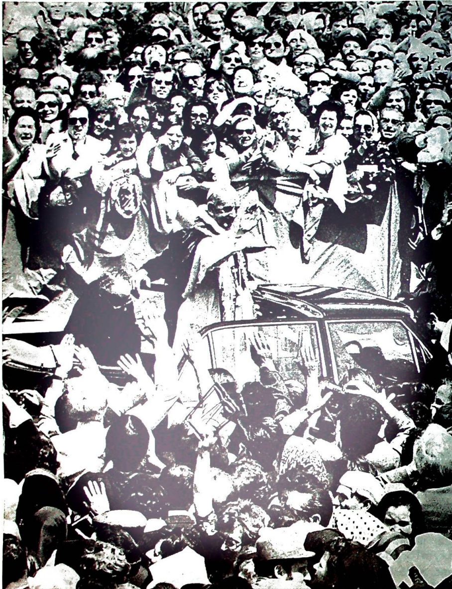
Paven i åpen bil på Petersplassen