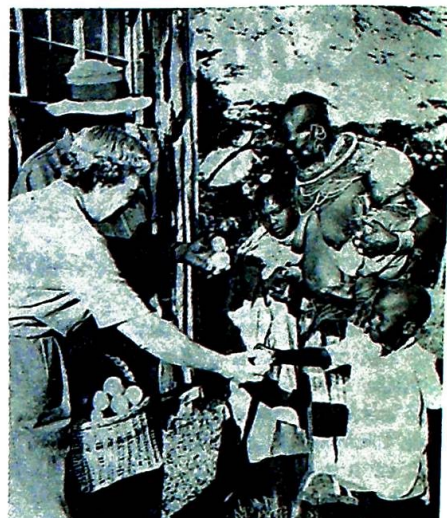
Misjon og u-land, se neste side.