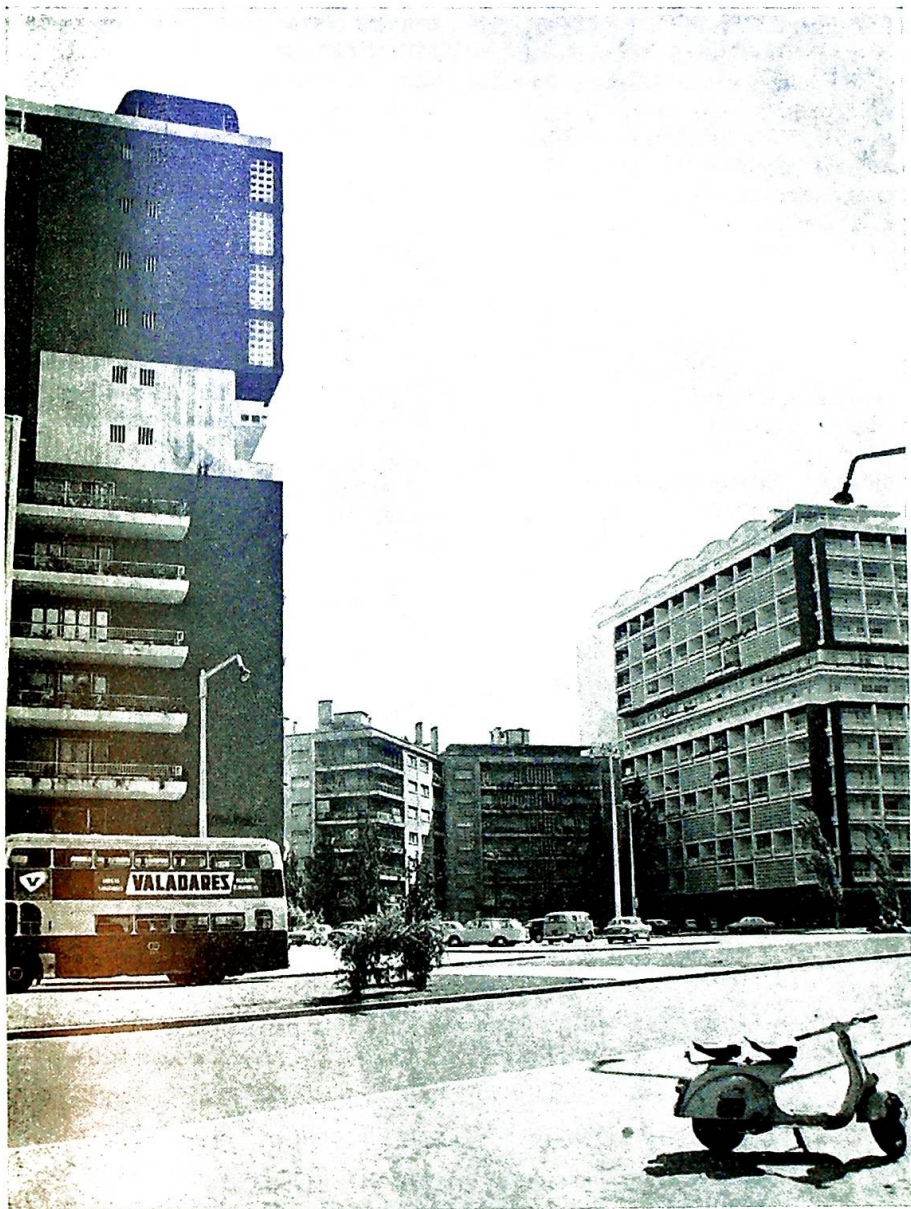
Lissabon — nye bygninger og eldre problemer.