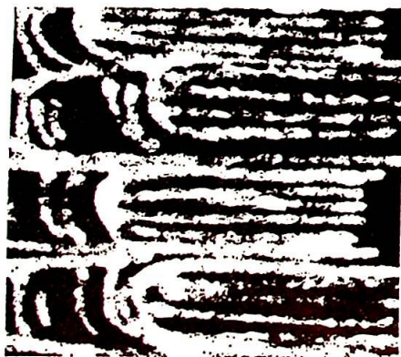
PAPILLON Av Henri Charrière. 57 sider, Cappelen.

Kanskje er dette en ny utfordring til katolske foreldre, en utfordring jeg vet at en del for lengst har tatt alvorlig. I langt større grad enn tidligere blir det de enkelte foreldres plikt og oppgave å ta ansvar og et stand-