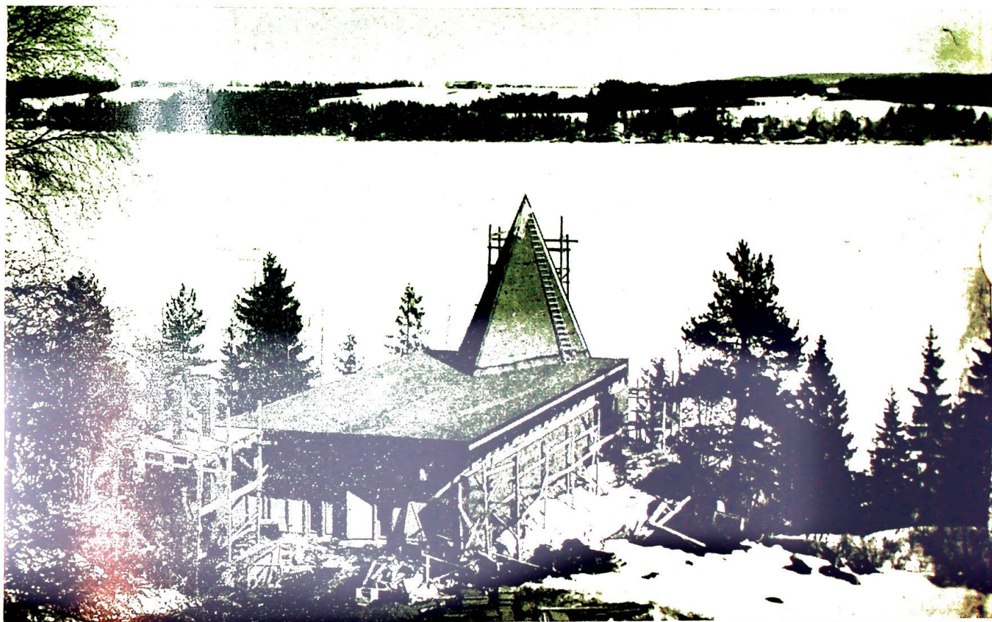
KAPELLET PÅ MARIAHOLM