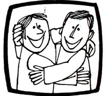
Ingen dånte —!

Gjør ikke noen få TV-kvelder hvor emnene behandles på en redelig måte det helt klart at man, ja, har stått på hodet hvis man har gjort dette til sin viktigste protestoppgave? At man har hatt en gal prioritering av tingene?