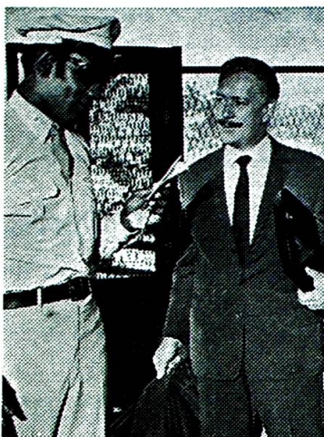
Raymond St. Jacques og Alec Guinness i «THE COMEDIANS»