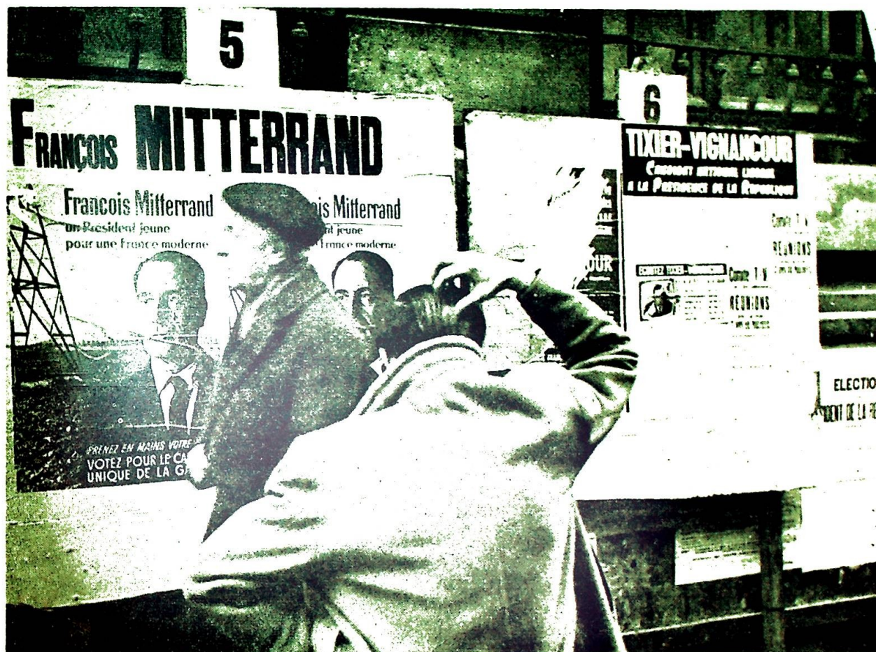
OM KATOLIKKERS POLITISKE ENGASJEMENT (side 136)