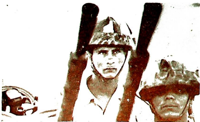
Midt-Østen: Aktuelt, informerende.