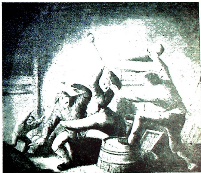
— vi vil måtte risikere at seerne kan bli konfrontert med sjokkerende opplevelser.