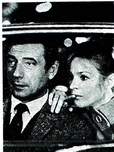
Yves Montand og Ingrid Thulin i «KRIGEN ER SLUTT»