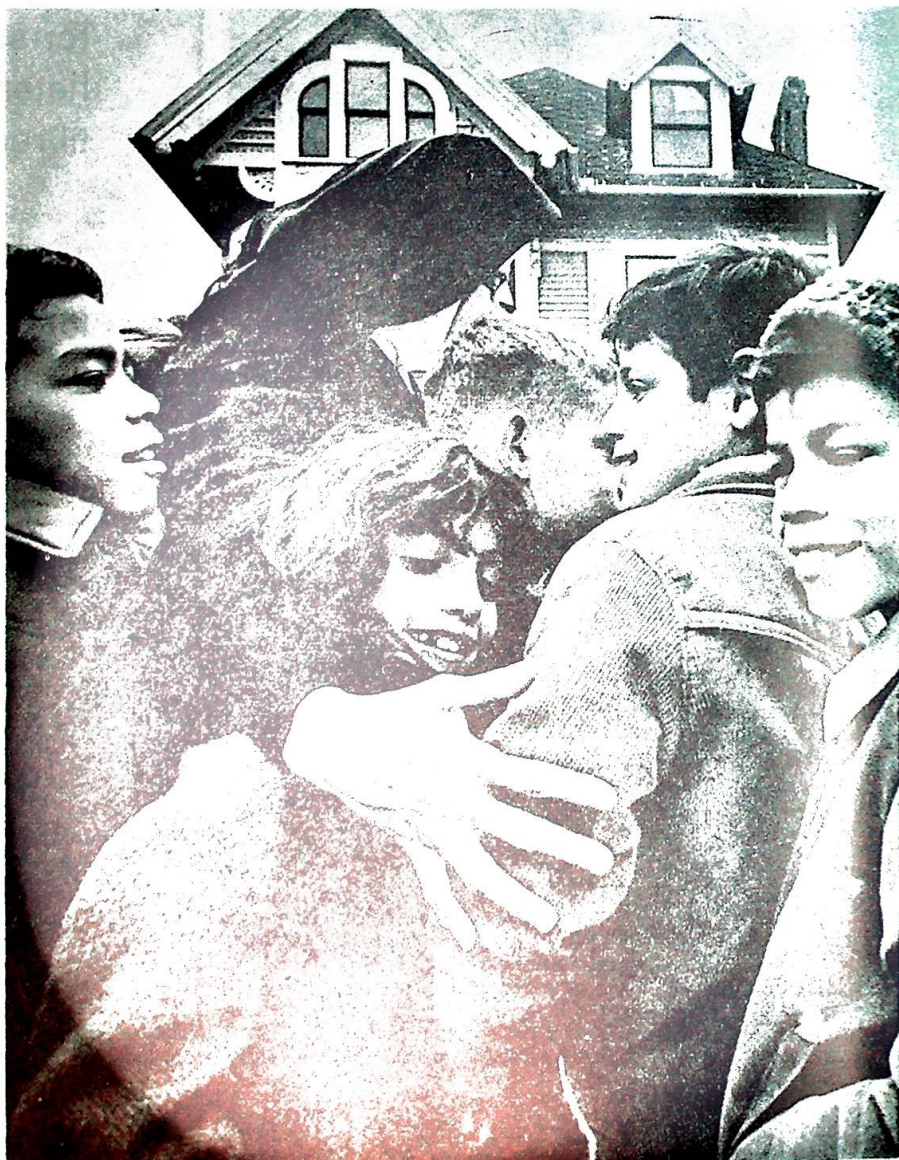
Menneskelig varme og forståelse preger dette billedet som en amerikansk fotograf har tatt av en ordenssøster og hennes elever på en skole i utkanten av New York.