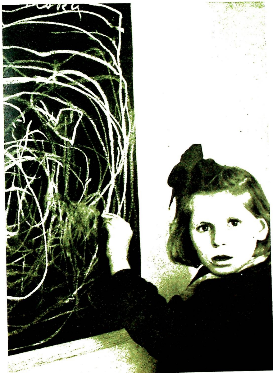
«ET BARN TEGNER KRIGEN»