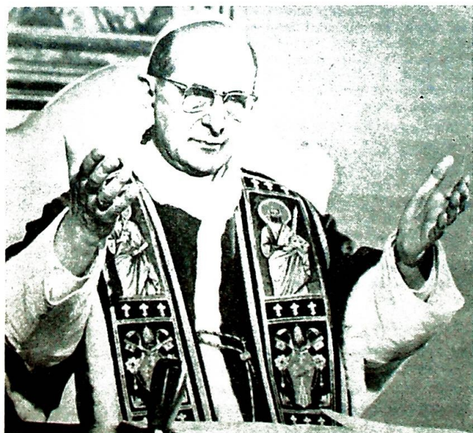
Dette bildet ble tatt av pave Paul i hans arbeidsværelse i Vatikanet et par dager før jul, det er under hans julebudskap i radio og fjernsyn til verden.