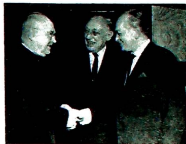
Kardinal Spellman blant venner.

En skulle tro det var selvinnsende samtidsforståelse — for kardinaler og andre. Det er det åpenbart ikke.»