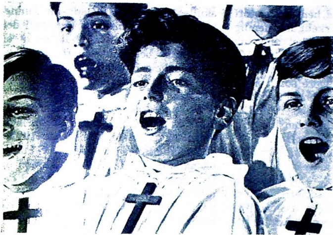
Hvorfor skulle sanggleden bare begrenses til skolelerte kirkekor?

DET FØRSTE KATOLSKE MUSIKERSTEVNE I KØBENHAVN