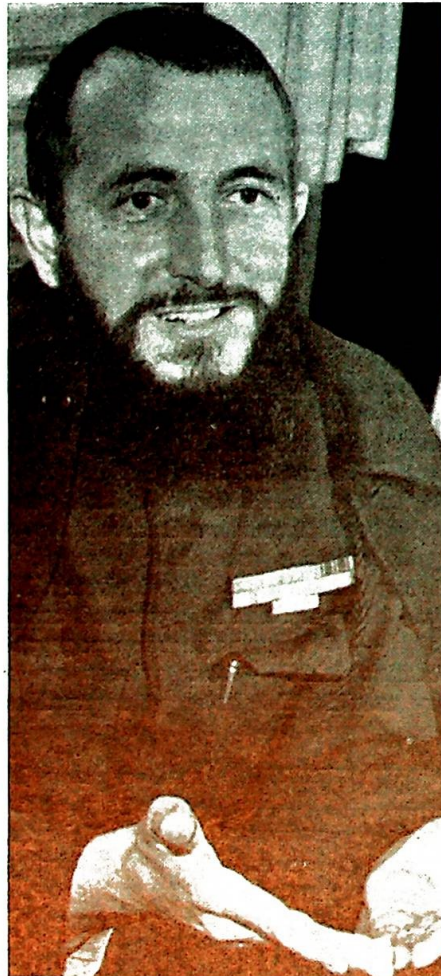
Abbé Pierre — glassblåseres fortrolige.