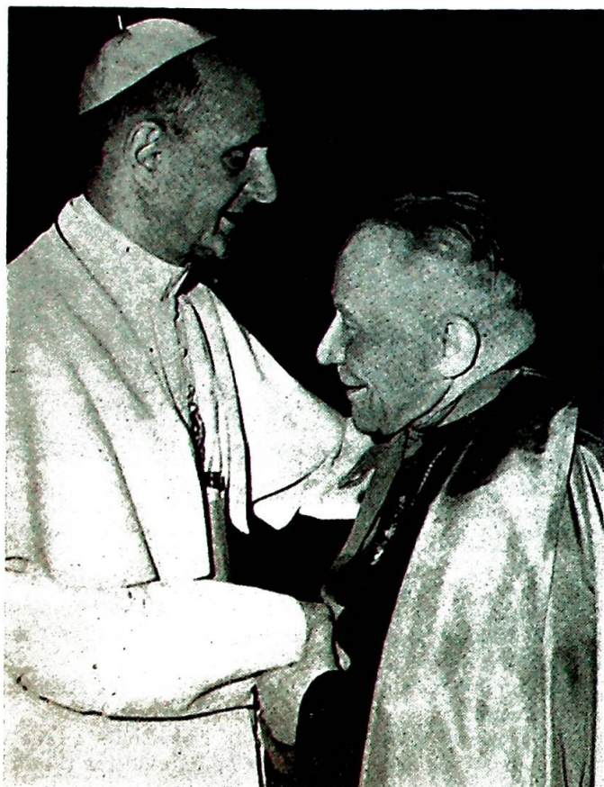
Efter 16 års fangenskap: Gjensyn med paven i Rom.