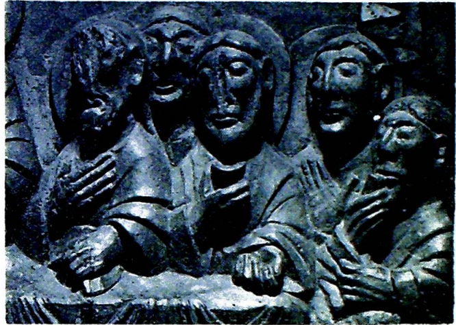
«Gjør dette til minne om meg!» Jesu eukaristiske befaling innebærer også vårt ansvar for prestedømmets videreføring i Kirkens liv. (Nadverdszene fra kirken S. Maria in Kapitol, Köln.)