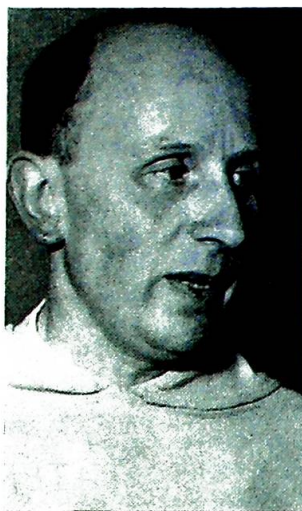
Yves Congar O.P. — et liv for de kristnes enhet.