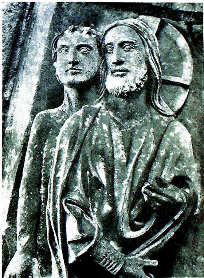
Mennesket og dets Skaper: Det er Guds Ord som gir oss liv og frelse.