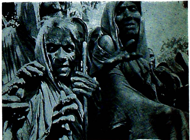
Sulten i verden — en frykteligere utfordring til vår kristne etikk enn «seksualmagistrene».