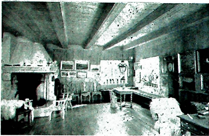
Peisestuen — Sigrid Undsets stolthet.

levde, ville hun som alle andre kunne åpne og lukke sitt hjem for hvem hun ønsket.