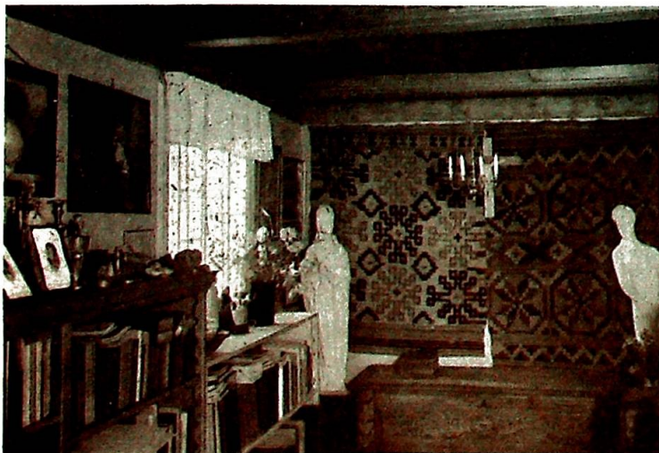
Fra Kleven — Sigrid Undsets dikterhule.

Var Sigrid Undsets liv lykkelig? Ut fra damebladenes lyserøde oppfatning av hva «lykke» er, var det jo ikke det — gavene og verdensberømmelsen ble vel under den synsvinkelen veid opp av tunge sorger og prøvelser. Hun mistet en elsket far da hun var bare 11 år, hennes eget ekteskap gikk i stykker, hun mistet sin eldste sønn på slagmarken, hun fikk et uheldredelig sykt barn, hun ble drevet i landflyktighet. Det er meget, i en enkelt skjebne. Det slet selv på så store krefter som Sigrid Undsets. Men som få andre, og med et visstnok uovertruffent mot, visste hun å «stemme sitt skrik til en sang» — kalle frem skjønne toner, om ofte i moll, av hva hun hadde levd og følt og tenkt. Umistelige rikdommer og verdier ga hun oss, fra sitt prøvede liv. Også det er lykke. Og på Bjerkebekk er det som om en, omgitt av hennes selvvalgte ting, kan glede seg over hennes gleder. Det er et hjem som ennå er gjennomlyst av en personlighet.