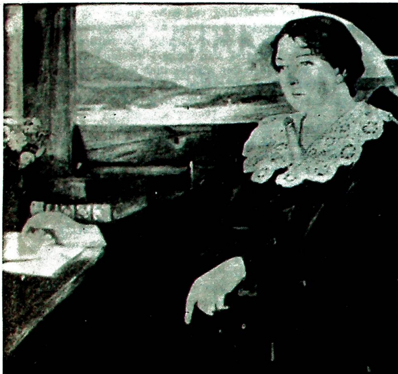
Harald Slott-Møllers noe romantiske portrett av husfruen på Bjerkebekk.

Ingen som kjenner Sigrid Undsets diktning, såvel middelalder-romaner som nåtids-skildringer, kan være i tvil om hva hjemmet har for en plass i hennes sinn. Et dikterhjem er ellers noe eget — det er rammen om en skapende fantasi hvis bilder er blitt folke-eie. Wergelands (og Arnulf Øverlands!) «Grotten», Bjørnsons Aulestad og Hamsuns Nørholmen — alle sier de oss noe fengslende om mennesket bak verket. Det gjelder også i høy grad Sigrid Undsets hjem på Lillehammer — Bjerkebekk.