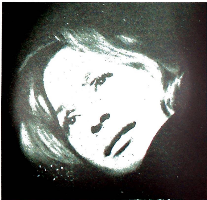
Filmen krever frihet til å skildre også det nevrotiske, det abnorme og det forfalne i menneskelivet.