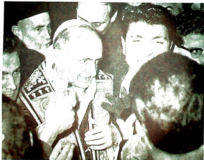
Et nytt og uvant syn: Paven midt i trengselen.