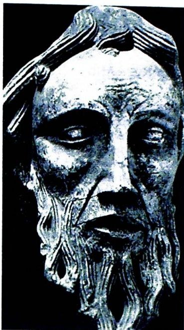
Apostelhode fra Senlis-katedralen.

VED DAMASKUS FIKK HANS LIV EN NY GRUNNVOLL