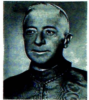
Den fransk kardinal Liénart, erkebiskop av Lille, er en av konsilets forgrunnsfigurer. Lille er et av katolisismens hovedsentra i Frankrike. Kardinalen er også øverste leder for en dynamisk nyskaping i den franske geistlighet: «La Mission de France».

I den franske presse finner en den samme vilje til forsiktig optimisme. «Le Monde» benytter anledningen, som det bunnhederlige presse-organ det er, til en liten selvransekelse på pressens vegne: «Konsilet blir ganske visst et storslagent skuespill, gjennom det praktfulle seremonielle som preger det og ved den storslagne ramme det får i sitt møtested, Peterskirken. Men det kommer ikke til å gi avisene anledning til fengende overskrifter og løpesedler (med mindre de fusker) og heller ikke vil det føre til store radio-proklamasjoner. Dets avgjørelser vil først virkelig bli kjent når det er avsluttet. Og når en kjenner dem, vil der enda trenges en rund tid før man kan kommentere dem på en hederlig måte. Når det gjelder de