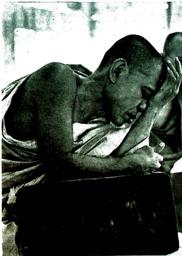
Har Østens mennesker bevart kontemplasjonens gave? Bare noen få, sier Koestler.

La det straks være sagt, at boken hele tiden fanger ens interesse; til tider er den ytterst fornøyeelig — særlig den delen som behandler Japan. Koestler påstår selv å