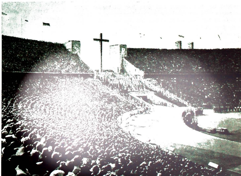
Et utsnitt av folkemassen på en tysk «Katholikentag».

...men også det store katolske folk av alle nasjoner