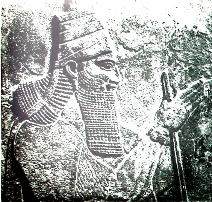
Tiglat-Pileser III, den assyriske kongen som erobret Israel.

Annen del av boken behandler det Nye Testamente på samme måte, forklarer den romerske okkupasjonen av Palestina, de forskjellige religiøse partiene i Israel. Selve beretningen om Jesu liv og død kan ikke bli annet enn overfladisk på så få sider, men så skal der også være plass til Paulus' misjonsvirksomhet. Noen korte forklaringer om arkeologiens verk i Palestina og om Palestina idag avslutter verket.