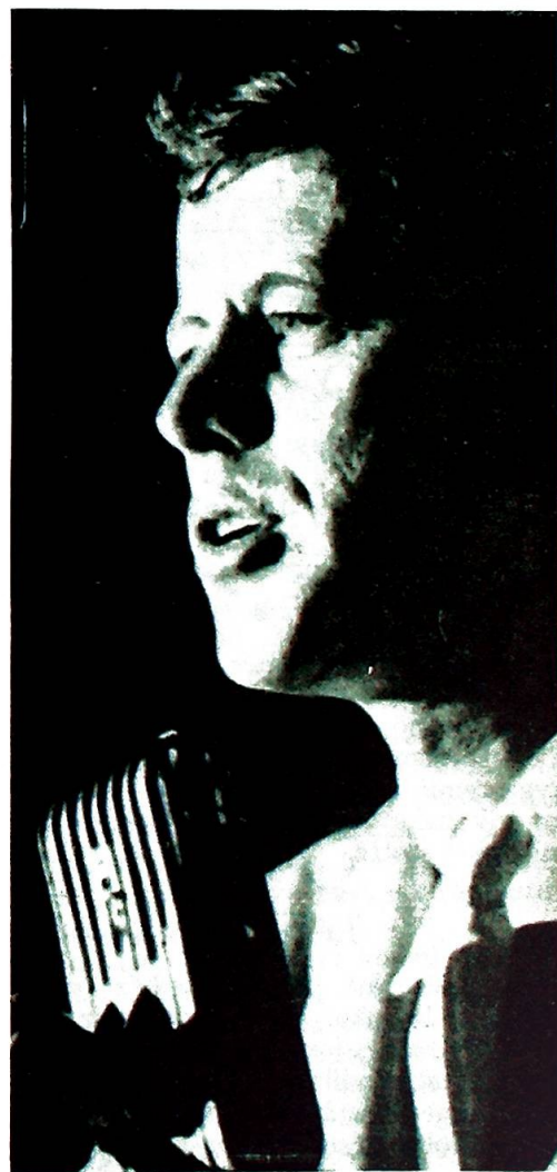
John F. Kennedy i aksjon.

Det første kraftige varselet om at tidene og mentaliteten har skiftet, fikk de på demokratenes partikongress i 1956, hvor den unge katolske senatoren fra Massachusetts, John F. Kennedy , seilte opp som en av de sterkeste kandidatene til vise-presidentembedet under Adlai Stevenson. Som kjent vant Eisenhower dette valget overlegent — annet var ikke