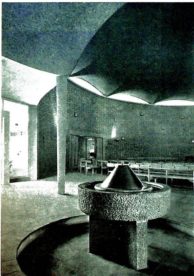
Utsnitt av kirkens interior. I forgrunnen døpefonten. Alteret henimot fonden t.h. (her ikke synlig), mens i fonden t.v. skimtes Sakramentskapellet.