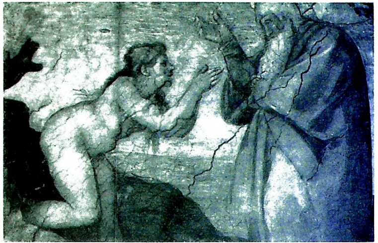
Gud kaller Eva, den første kvinne, frem fra den sovende Adam — Fresko-detall av Michelangelo i Det sixtinske kapell.

Den evige Gud er kommet for å virke i tiden , men etter hans virke i seks dager følger — i beretningen — en syvende dag, der Gud igjen trekker seg tilbake og hviler. Hvis mennesket er Guds bilde, har det også den samme bestemmelse: etter å ha virket i tiden med dens skiftende netter og dager, en gang å kunne få trekke seg tilbake til evighetens hvile, til den dag som ikke kjenner aftenen. Beretningen inneholder altså en fin hentydning til menneskets evige bestemmelse, selv om vi ikke finner våre sedvanlige uttrykk som himmel eller lykksalighet.