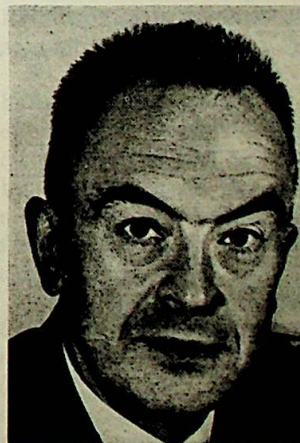
Helsedirektøren — er han «nøytral»?