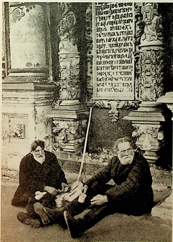
Dette foto er tatt så sent som ifjor og viser pilegrimer utenfor Zagorsk-abbediet, der de kommer for å be ved St. Sergius' relikvier. (Sergius ble lyst hellig i 1448—49 av Den ortodokse kirke og æres også for sin hellighet av troende av romersk ritus).

Et annet betydelig retrettsted i nord var Valaamo ved Ladogasjøen. Det var et av Russlands eldste klostre og antas å være grunnlagt i det 10 århundre, da de første greske misjonærer ankom dit, altså endog før Russland var omvendt til kristendommen. Også Valaamo var anlagt på en øy, adkomsten dit måtte foregå med båt, og det kunne ofte være farlig. Avstanden var omkring tre mil, men selv om været var pent, fikk pilegrimene en følelse av at de forlot verden og oppdaget nye åndelige dimensjoner. I likhet med Solovetzk, var Valaamo selvforsørgende og hadde en stab av dyktige byggmestere, ingeniører og teknikere. Når prioren eller «igumen» som han kaltes, ga en eller annen tillatelse til en munk eller en besøkende, ble det sagt at han bekjentgjorde eller proklamerte sin avgjørelse, ikke som en sjef, men snarere som en basunengel. I Valaamo og de fleste russiske abbedier var det flere kategorier munk, noen var presteviet, andre hadde avlagt munkeløftene, men var ikke prester, og andre igjen var noviser og postulanter. Dessuten var det i disse, såvel som i alle orientalske strenge klostresamfunn, enda en kategori, de såkalte «shimo-monakhy» eller eremitter. Med abbedens tillatelse levde de fullstendig tilbake trukket i skogen eller i underjordiske celler, langt fra den øvrige del av klostresamfunnet. Disse eremitter hadde forpliktet seg til absolutt taushet, ofte