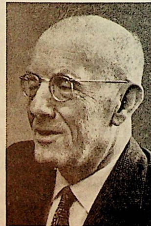
Oscar Cullmann — tror på hjertelaget.

Men Cullmann ønsker å fremme ytterligere denne menneskelige tilnærming ved å gjøre den konkret i en gestus som også blir forstått utenfor teologenes akademiske krets. Og med apostelen Paulus' innsamling til de fattige kristne som forbilde og symbol på solidaritet, foreslår han at katolikker og protestanter mer og mer skal kappes i nestekjærlighet overfor hverandres trengende. Tanken har møtt skepsis, men ennå mer begeistring på begge sider av konfesjonsgrensene, og synes å fenge. Cullmann har holdt foredrag over hele verden, sist i USA, for å utbre tanken, og forteller at «i Rom puttet en ukjent munk en pengeseddel i lommen på meg, med en lapp hvor det sto skrevet: Fra en katolsk munk til en fattig protestant som tegn på kristen solidaritet. Jeg ga summen til lederen for valdensernes seminar i Rom. Han fortalte sine studenter om dette, og helt spontant laget de en innsamling av sine beskjedne midler og sendte resultatet til abbeden for et stort kloster i Rom, med anmodning om at det måtte gå til en som var i nød.»