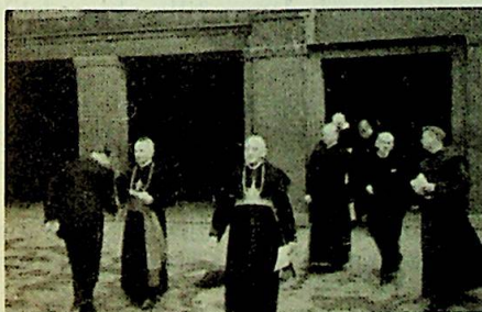
Hilsmingsmøtet er slutt.