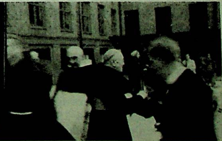
Men gratulantene strømmer raskt innpå...