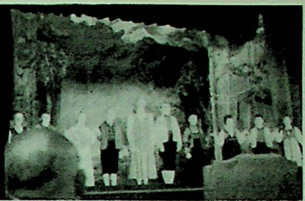
Ved et praktfullt tablå deklamerte barn ved St. Josephs Institutt Internat den yngste generasjons takk til Overhyrden.