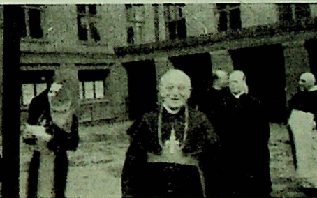
Jubilanten forsøker å unnsnippe.