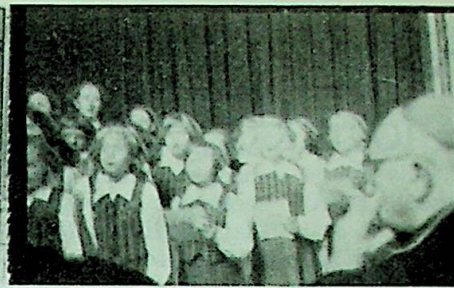
St. Sunniva Skolekor høstet varm applaus for sin nydelige sang. — I forgrunnen biskop Wember.