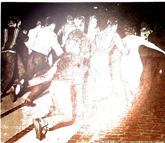
Lemmys beundrere i aksjon.

Det er ikke bare på den københavnske Raadhuspladsen — ti skritt fra Scala Bio som uke etter uke viser Lemmy «i storform» — at «Lærjakker» og politi tørner sammen i blodige oppgjør. Stockholms-«kravallerna» på Nybroplan er nesten allerede for en tradisjon å regne, og heller ikke Oslo er gått fri. Visse individuelle forbrytelser kan trygt sees i samme perspektiv: To unggutter har igjen nylig slått en drosjesjåfør i Oslo sanseløs for å skaffe seg penger. Det ser så lett og sorgløst ut på film, dette å slå bevisstheten ut av et menneske — han ruller med øynene og får oss til å le med sitt skjeve smil og sine sviktende ben. Men virkeligheten heter slag på slag og strupetak og blod. Offeret må på operasjonsbordet, og avisen kan fortelle at den aldrende mann nettopp var kommet seg, omsider, etter et tidligere overfall: Hva er det for et samfunn vi får? Først da de konfronteres med sitt forbundne og medtatte offer begriper de visst noe av det de har gjort — og gråter. Har det faktisk vært en uoverkommelig pedagogisk oppgave å inngi disse ungguttene en elementær sans og fantasi for menneskeverdet, forpliktelsene, det hederlige strevet i dette familiefor-