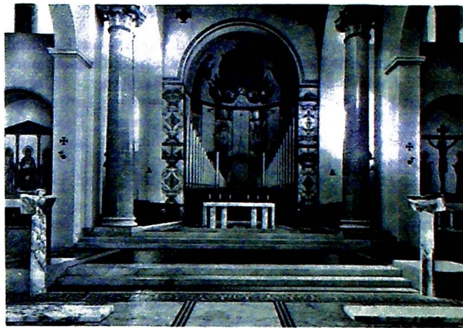
San Anselmos rommelige kor.

Treport og arkitektur fra det 5. århundre.