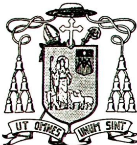
Biskopens våpen som Apostolisk Vikar 1932—53.

Høytelskede i Herren! — Ut omnes unum sint: «At alle må være ett, at alle må bli ett», det er deres nye overhyrdes valg- sprog. Og når jeg i dag for første gang henvender meg til dere alle, så er det ikke for å skrive en teologisk avhandling eller en lang belæring, men bare med det formål i korthet å forklare mitt valgsprog. Det inneholder hele mitt pro-