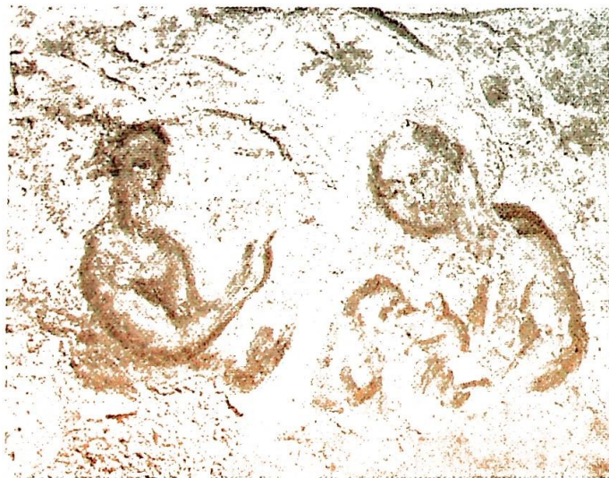
Profeten og Madonna med Barnet. — Priscilla-katakombene i Rom.

Allerede før frelsen er «fullbrakt», ser vi den virke i henne som først fikk del i den. Hennes attrå står ikke til noen mann, ingen mann rår over henne. Her fødes et barn uten kval. Kvalen kom senere, da hun måtte overveie og erfare hva det lå i det navn som ble pålagt henne å gi sitt barn: Jesus (= Jahve frelser) — navnet «til fall og oppreisning», så hun en dag, under korset, kunne trekke et sverd ut av sitt gjennomstungne hjerte og gi det til martyrene. Er Gud selv blitt vår bror, har vi felles mor, og hun har ikke opphørt å være for oss det hun var for Johannes: Se, din mor! , selv om hun har lukket sine øyne på denne jord for å slå dem opp der hvor hun også skal se det i sin Sønn, som hun her