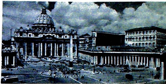
Roma, Påsken 1957.