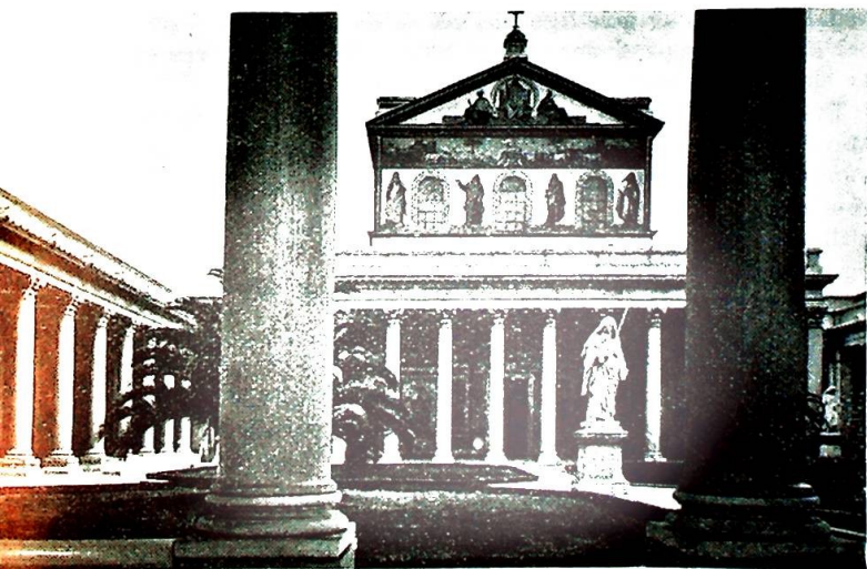
Den praktfulle søylegård foran St. Pauls basilikaen: San Paolo fuori le mura — St. Paul utenfor bymuren.

Desto mer særpreget og ekte romersk folkelig er den