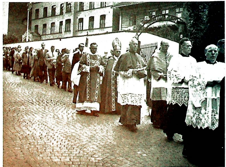
Fra prosesjonen 24. august, med St. Olavs-relikvien.

Høytelskede i Herren, så vil vi da takke Gud for all den nåde og velsignelse han nå i 100 år har latt strømme gjennom St. Olavs kirke, der han tender, nærer og styrker troens lys i oss. Og vi vil love ham å bevare denne tro ren og glødende, så den i sannhet kan være en støtte for vår fot og et lys på vår veg fram mot evighetens land. Og det vil den være når vi alltid kan si med Salmisten: «Herre, vi vil mette oss med de gode ting i ditt hus, ditt hellige tempel.»