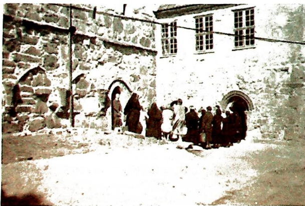
Fra omvisningen i de gamle bygninger til Ulstein Kloster. T. v. kirken; t. h. bibliotekfløyen.

St. Laurentius-abbediet på Utstein ble opprettet for nesten 700 år siden, i kong Magnus Lagabøters regjeringstid. Det var Augustiner-korherre som hadde der til året 1537 da kong Christian III. ga eiendommen til danske adelsfolk.