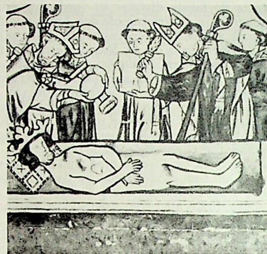
En av de fire Olavs-fremstillinger på antemensalet i Trondheim Domkirke.