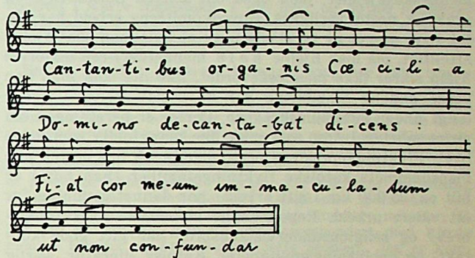
Antifon til Laudes fra liturgien på den hellige Cecilias festdag, 22. november.

Når man tenker på at denne utelatelsen nettopp finnes i et stykke fra «dagtidene» i Kirkens timebønner, altså når folk helst var tilstede, så skjønner man også hvor lett idéen om Cecilias aktive musisering kunne festne seg. Fra det 14. århundre og like opp til i dag har dessuten billedkunsten støttet godt opp om denne idé. I Europas kunstgallerier finnes de herligste malerier av den syngende og spillende Sankta Cecilia. Som regel er det orgel hun spiller, en sjelden gang også harpe eller et strykeinstrument, f. eks. på et par berømte bilder i Louvre av Pierre Mignard og Domenico Zampieri («Le Dominiquin»). Et av Rafaels mesterverker fremstiller henne stående sammen med apostlene Johannes og Paulus, Maria Magdalena og St. Augustin, blikket er løftet mot himmelen og hun lytter, som de andre, henført til en overjordisk konsert. Kan-skje er det slik vi helst skal huske henne? Vi har ikke noe bevis for at hun, slik som den andre beskytteren av kirkemusikken, St. Gregor I, (eller St. Pius X, som