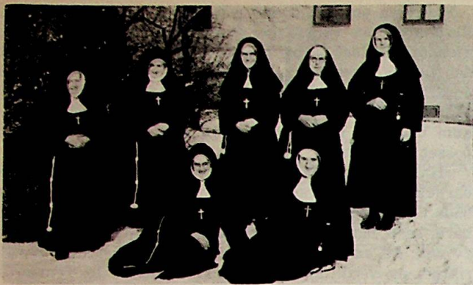
Søsterlig vinteridyll i prestegårdshaven.