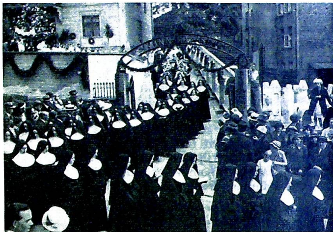
St. Josephssøstre i Kristi-Legemsprosesjon i Oslo.

fra 3. skoleår. Så kan en nok si at vi legger stor vekt på håndarbeide for pikene og på å la elevene få øve seg i skuespill. Vi har fått litt av en skuespilltradisjon nå.