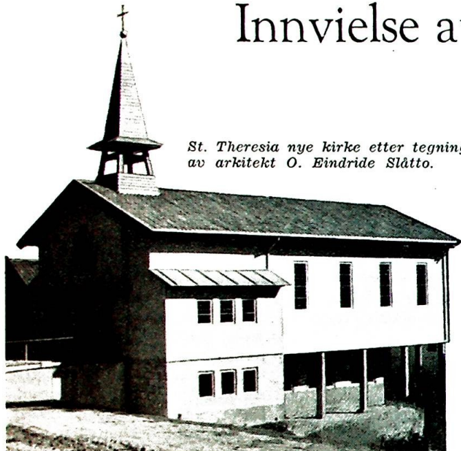
St. Theresia nye kirke etter tegning av arkitekt O. Eindride Slåtto.

For ordens skyld nevnes at manuskriptet til nærværende referat i hovedtrekkene også har vært benyttet av «Morgenposten» og «Ringerikes Blad».