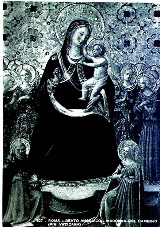
Beato Angelico: Madonna med Barnet omgitt av engler. Nedenfor kneeler St. Thomas Aquinas og Sankta Caterina av Siena.

Og så skjer det likevel, at da han nå kommer fra disse to kunst-gigantene og til deres beskjedne forløper, — for i alt han har gjort, virker Fra Angelico naturlig beskjeden — så er det som de plutselig står i skyggen av en enda større gigant. Hva kan det skyldes? Som ren maler var Fra Angelico neppe mere betydelig enn de, ja, kanskje ikke engang så betydelig. Men alle hans bilder, fra det mest til det minst vellykkede, er fylt av en ånd som man ikke finner maken til hos noen annen kunstner. For Fra Angelicos ånd er ikke bare en troende og tilbedende ånd, men en ånd som befinner seg i selve Paradiset. Det er ikke en ånd som skuer Gud utenfra, men en som lever i Kristus selv, og som derfor også ser på alt med Kristi egne øyne, så godt som det er mulig for noe menneske her på jorden.