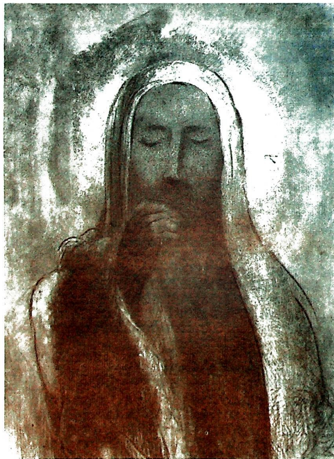
Odilon Redon: «Kontemplasjon»

Som om det dypere sett er noen grunn til å fryde sig over hver engel som henges ribbet på en snor. Som om det egentlig er berettiget å gratulere sig selv med at selvbedragernes liste også omfatter Jesus fra Nasaret. Som om det var noen årsak til å juble som frigitte dødsdømte at noen forkynner vår ugjenkallelige dom! Her ligger et stort skib seilklart for evigheten, og det byr oss med på en reise mot den strand vi skaptet for. Rimelig er det at vi