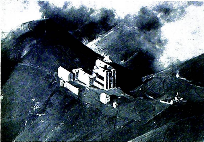
La Salette — åbenbaringsstedet i de franske Alper.

A tlasset lå åbent på bordet, Frankrigskortet blev studeret, nogle blækstreger viste allerede de første planlagte hovedpunkter af en rejse i det sagnomspundne land. Paris — Citeaux — Lerins, — står der over tre af mærkerne. Til Citeaux kom vi engang i sommer, nu vil jeg forsøge at tage Dem med videre et stykke.