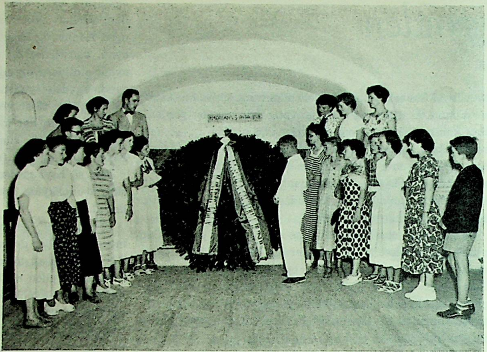
Latinartianerne ved Oslo Katedralskole 1952, bekranser sarkofagen til pave Hadrian IV — Nicolaus Brekespear — i Roma sommeren 1952.