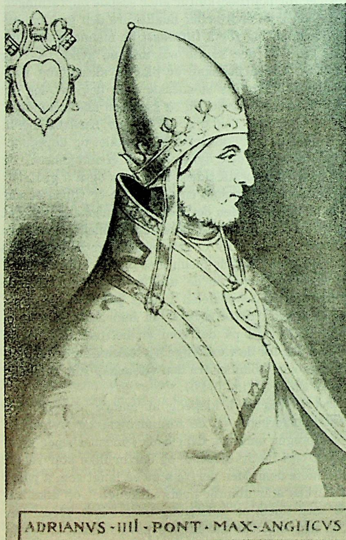
Den engelske kurie-kardinal Nicolaus Brekespear — pave Hadrian IV.