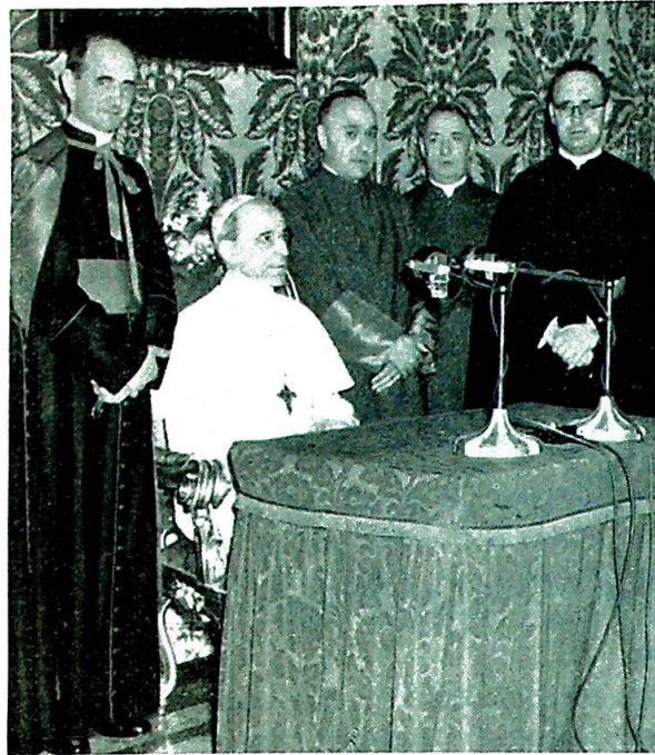
Pave Pius XII ved mikrofonen, som vanlig omgitt av de tje- nestegjørende monsignorer. Helt t.v. på bildet Pavens høyre hånd i den daglige ledelse av Statssekretariatet, pro- sekretæren mgr. Montini.

Denne hjerteskjærende situasjon, viser seg i et enda grellere lys, når vi tenker på at på den ene side produserer jorden nok til alle og at de store siviliserte nasjoner bruker en stor del av sine umåtelige rikdommer til å lage våpen og til å finne ut nye midler til å drepe og ødelegge, og å øke nøden og elendigheten. Kan hende de føler seg nødt til det for ikke selv å bli slettet ut. Men det viser hvor langt