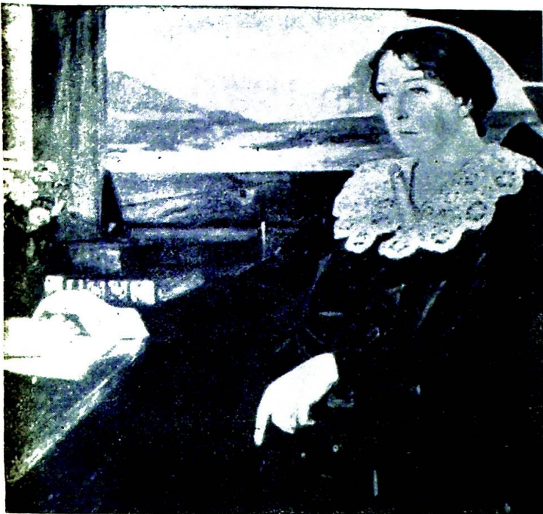
Etter maleri av Harald Slott-Møller.

nuft. Iallfall i det religiøse. — Sigrund Undsets mennesker er herlig enkle og ukompliserte selv om deres livsskjebne såvisst ikke er enklere enn vår. For dem er det selvfølgelig dette at livet, det er en kamp mellom det onde og gode i mennesket. Valplassen er i en selv. Vekten i Sigrund Undsets svar ligger i at hun gir oss denne fundamentale, evige sannhet genialt illustrert i det norske middelaldermenneskes dagligdagse liv.