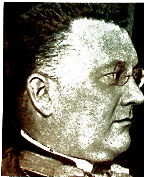
Erkebiskopen av Paris, Mgr. Maurice Feltin, kardinal Suhards arvtager.