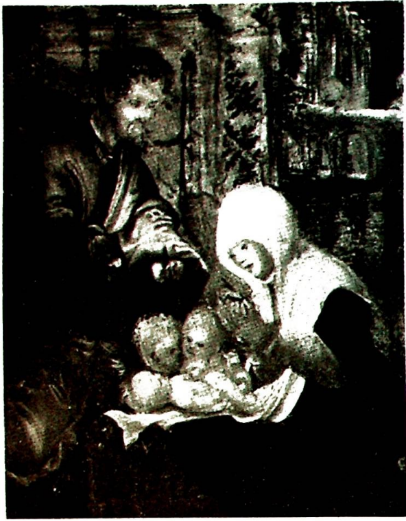
ALBRECHT ALTDORFER: Julenatt. Detalj. (Fra Wienerutstillingen.)

menneske. Han er kommet for å kunne forkynde: «Hva gagnar det mennesket om det vinner hele verden, men tar skade på sin sjel.» Det er sant, — Jesus lar ikke menneskene i fred, — fordi han elsker menneskene, fordi han elsker våre udødelige sjeler.