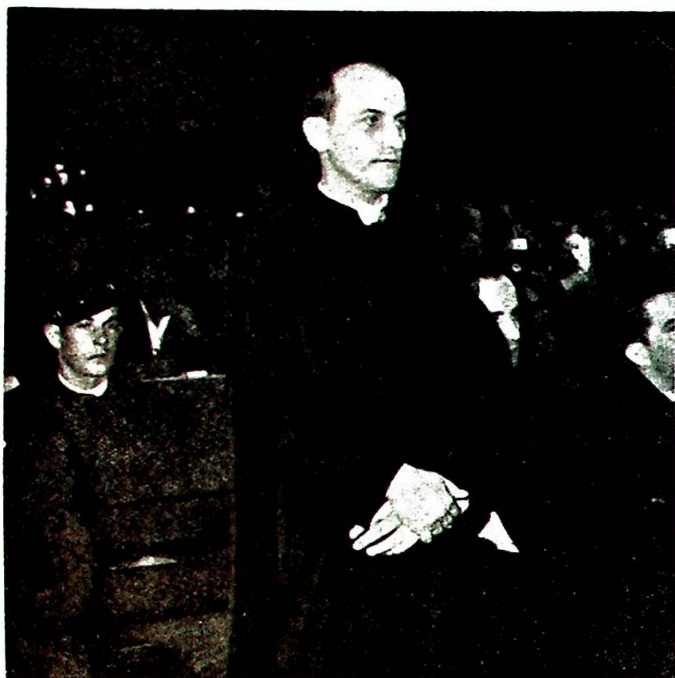
Erkebiskopen av Zagreb, Mgr. Alois Stepinac — i sin tid verdens yngste erkebiskop, bare 36 år gammel. Her ses han 12 år senere for «folkedomstolen» i Zagreb idet han mottar sin dom på 16 års tukthusstraff: «Jeg ber ikke om nåde. Min samvittighet er ren.» — Hans utnevning til kardinal er mer oppsiktsvekkende enn Mindtzentys i 1945.

Pave Pius XII lot, som meddelt i forrige nummer, lørdag den 29. november kunngjøre navnene på de 24 kirkelige dignitærer som i et hemmelig konsistorium den 12. januar vil bli tildelt kardinals verdighet. Det hellige kollegium vil dermed, forhåpentlig, igjen være fulltallig (70) for første gang på mer enn to hundre år. Dette hadde vært pavens mening også i 1946, men erkebiskopen av Genova, som var blant de nytutnevnte, døde innen konsistoriet ble holdt. Etter det formelle møtet den 12. januar mellom paven og de hittidige kardinaler som kan ventes til Rom for anledningen, vil tre dager senere, 15. jan., det åpne konsistorium finne sted, der de nye kardinaler så mottar den røde hatt fra pavens hånd. Alle de 24 nytutnevnte unntatt erkebiskop Stepinac vil innfinne seg. Han har uttalt at han eventuelt måtte be om tillatelse fra de kommunistiske makthavere, og han anser seg på ingen måte skyldig til en slik underkastelse. Dessuten ville han aldri slippe inn i Jugoslavia igjen. «Min plasse er her, og jeg skal forbli her selv til min død, om nødvendig.»