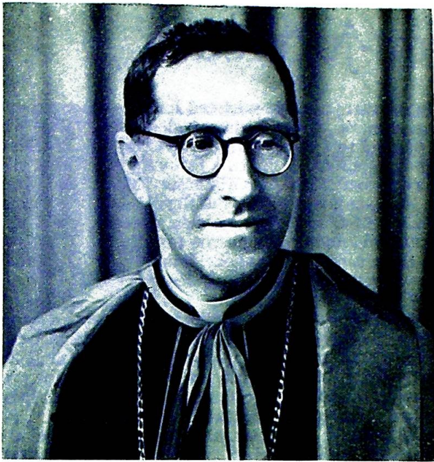
Erkebiskopen av Genova, Mgr. Siri, som med sine 46 år blir kardinal-kollegiets yngste medlem.