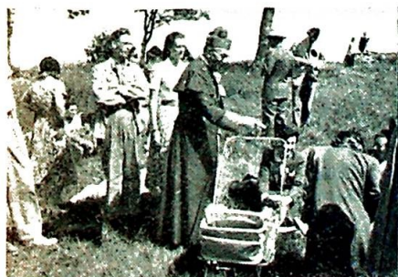
Hr. Høyerv. biskopen hilser på yngste deltaker ...