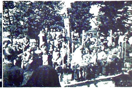
Et utsnitt av de vel 600 mennesker som fulgte messens hellige handling.