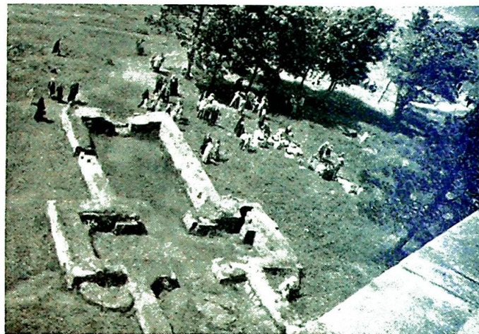
Slik ligger Mikaelsskinner på let. M trakk her et

St. Olavs Forbund hadde valgt Tønsberg til møtested for sitt årsstevne søndag den 22. juni. En kunne ikke ha valgt et bedre sted enn Norges gamle hovedstad, og dagen ble en suksess som sent vil glemmes av dem som tok del i stevnet.