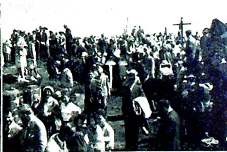
Glad stemning på stevneplassen.