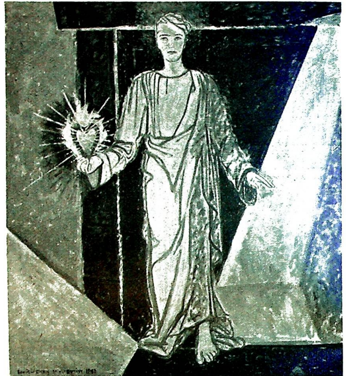
Etter Henrik Sørensens fresko i Lørenskog kapell.

Ingen er so langt burte at ikkje kross-armane peikar på han, ingen er so nedforkomen at strålane frå Kristi åsyn ikkje kann nå han, so alle skal sjå og vita kva lengd og breidd og og djup og høgd den kjærleiken eig som Han elska oss med, Han som hang på krossen for vår skuld, til eit offer som aldri endar, so korkje liv eller daude, korkje herrevælde eller makter, korkje det som no er eller det som koma skal, korkje høgd eller dypt eller nokon skapning, korkje det som er på jordi eller det som er over eller under jordi skal kunna skilja oss frå Honom som gjorde seg til eitt med oss og gjorde oss til Guds born, til sine eigne brør.