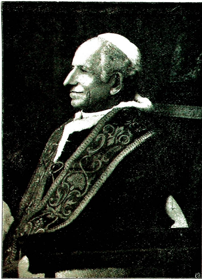
Pave Leo XIII — det store navn innenfor Kirkens sosiale lære.