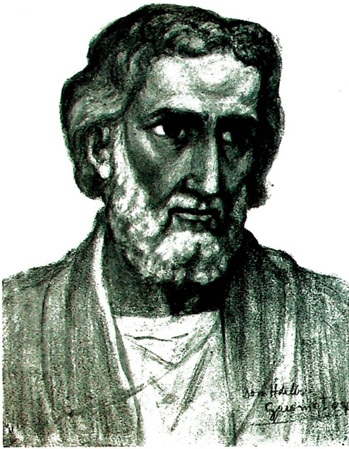
St. Joseph. Etter tegning av Dom Adelbert Gresnigt, O.S.B.