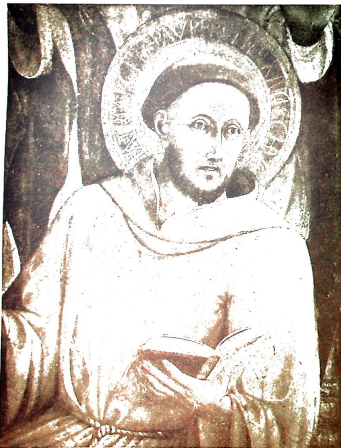
Sassetta (ca. 1400—1450): Frans av Assisi — detalj fra «Madonna av sneen», nå i florentinsk privateie. (Reprodusert i St. Olav 1949, men uten beskrivelse.)

Frans ville også elske Faderen slik som Jesus hadde elsket Ham. Han sa det uavlatelig. Han sang om det i sin skjønne «Solsang». Han levde i forening med Den Hellige Treenighet og dyrket den av hele sin sjel. Med øm kjærlighet elsket han Guds mor, Maria, slik som Jesus hadde elsket henne. Han æret Guds engler. Han fastet førti dager for på en verdig måte å forberede seg til St. Mikael's festdag. Og Gud fremmet alt dette ved et vidunderlig sammentreff av omstendigheter. Gud styrer alt hen til det mål som Han har satt for hver enkelt av sine skapninger. Frans følte og forstod dette. Hvilken kjærlighet hadde han ikke til menneskene! Han elsket Gud i alt det skapte og især i alt det levende. Livet er jo bildet på