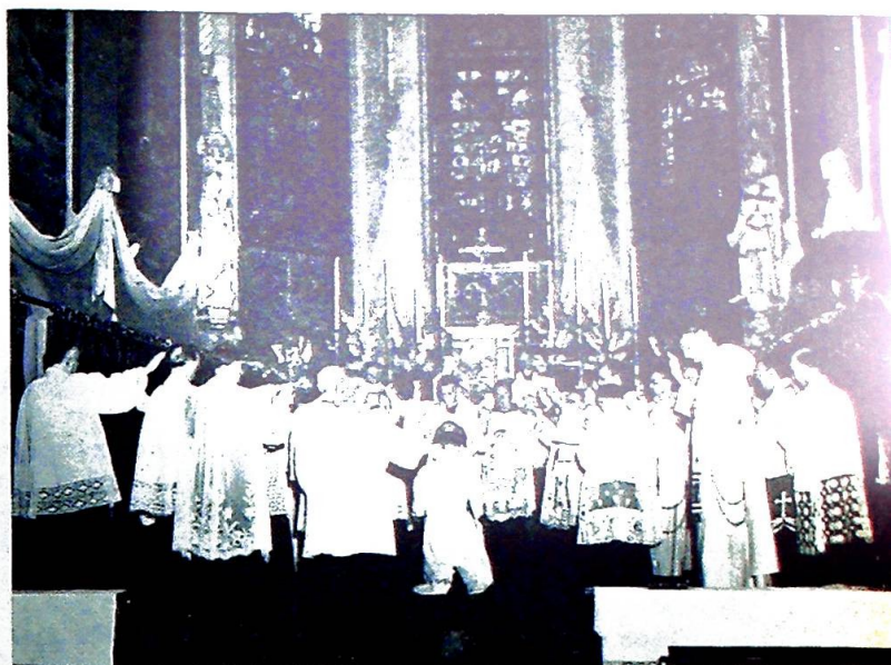
Biskop og prester har en for en lagt hendene på ordinandens bode, og blir stående i en ring med händen utstrakt til velsignelse.

Derfor ber jeg dere alle, ikke bare å følge nøye med i prestevigslens seremonier, men fremfor alt å forene deres bønner med biskopens og prestenes bønner om at ordinanden må bli en hellig prest til signing for Kirken og sjelene, sin familie og fedrelandet, sluttet biskopen.