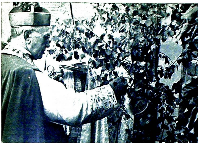
Fra innvielsen av St. Fransiskus-Xaveriussøstrenes postulats-bus i Kützberg.