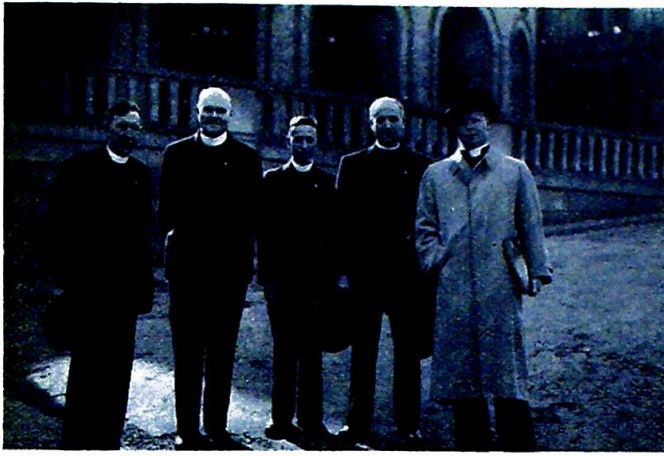
Ved den Geofysiske kongress i Oslo i 1948 tok også en gruppe Jesuitpatres del. Her sees 4 representanter fra henholdsvis Australia, Amerika, Argentina og Frankrike sammen med St. Olavs redaktør — foran Stortinget!

funnet i de europeiske land, beslutter han å stille sin «compagnia» helt til pavens disposisjon for å bli satt inn som spesiell støttetropp («kommando» sa man i den siste krig) på de vanskeligste frontavsnitt i kirken. Effektiv hjelp kunne bare ytes ved en slik sentralisering under pavens direkte ledelse. I de enkelte bispedømmer forekom det i den tid dessverre at bispestolen og kanikkstillingen først og fremst ble betraktet som inntektskilder som adelige herrer sikret seg for sine protesjéer; selve embetsstyrelsen ble da overlatt til mer eller mindre skikkede stedfortredere. I flere bispedømmer gikk bispene i reformasjonstiden over til den nye lære og forsøkte å føre hele bispedømmet med seg. Her trengte moderkirken en sentralisert redningsaksjon. Og der ble jesuitene de første og viktigste pionérer. De preket åndelig fornyelse i by og bygd, opprettet skoler og kollegier; deres beste teologer tok del i kirkemøtet i Trient, (f. e. Laynez og Canisius), andre utførte vanskelige oppdrag som pavens sendemenn til fyrster. Samtidig åpner de store oppdagelser i Amerika og India veldige misjonsmarker og det er jesuittorden (f. e. Frans Xavier) som her gjør det imponerende pionérarbeid.