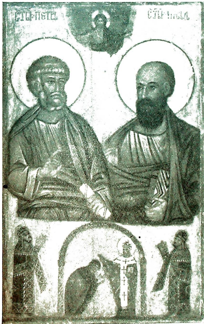
Peter og Paul — i kirkens lysende skikkelser i «Una Sancta». — Den ene hellige (kirke).

Spør man hva og hvor Kirken er, så er det altså ikke nok å si at Kirken er der hvor Ordet blir forkynt og mottatt med tro, og hvor sakramentene forvaltes riktig. Kirken, det er Kristus som lever sitt liv i menneskeslekten, eller: Kirken, det er hele menneskeslekten for så vidt den lever i Kristus. For det finnes mennesker nok i den vide verden som aldri har hørt Ordets forkynnelse eller mottatt sakramentene. Allikevel kan de ved Guds nåde bli tatt opp i Kristus som Guds barn. Også de salige i himmelen er lemmer på Kristi Legeme. De hverken trenger Ordets forkynnelse eller sakramentene, og deres tro er blitt forvandlet til det himmelske klarsyn. Allikevel er deres liv et fellesskap med Kristus og med alle kristne på jorden og i skjærsilden.