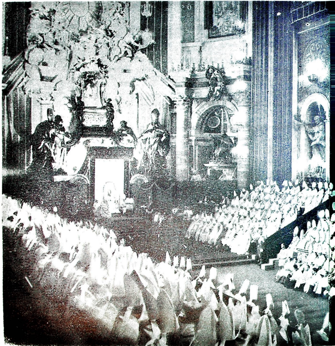
Et utsnitt av de henved 600 biskoper, erkebiskoper og kardinaler som var sam- let i Peterskirkenes kor 1. november. På tronstolen i bakgrunnen Pave Pius XII.

Av St. Olavs redaktør, Città del Vaticano 1. november.