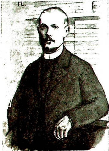
Charles Péguy (1873—1914)

Etter en tegning av Jean-Pierre Laurens.