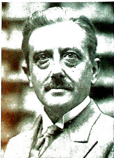
Georges Bernanos (1888—1948)

Péguy har fått troens gave igjen. Fra da av kommer han stadig tilbake til de samme temaer: pengenes tyranni, nådens og frihetens innbyrdes spill, håpets dyd, helgenenes forbønn, vårt samfunn med dem, Guds kjærlighet til menneskene. Og allikevel går han ikke til sakramentene, de samme sakramenter han skriver vidunderlige ting om. Han går ikke engang i messen, unntagen noen dager før sin død. Hvorfor det? Det er blitt gitt forskjellige forklaringer. Ingen av dem er helt tilfredsstillende. Péguy hadde sannsynligvis fremfor alt en slags bevissthet om et særlig kall, han følte seg solidarisk med alle dem som fremdeles sto «utenfor», han ville ikke gå fra dem. Han har tatt sin hemmelighet med seg i graven. Han døde for sitt fedreland på fronten den 5. september 1914. Han ligger begravet der han falt. En ting er sikker: Den innflytelse han har hatt på ungdommen etter sin død er umåtelig stor. Vi har et symbol på det, nemlig at tusener og atter tusener av pilegrimer nå går den vei han, først av alle, har gjenoppdaget, veien til Chartres. Dette er et synlig tegn. Hans innflytelse går meget dypere. Han har lært unge katolikker å gå med løftet panne, som frie mennesker, i den moderne verden, styrket fremfor alt av de enkleste men også dypeste sannheter i den katolske katekisme. Fra dette synspunkt kan vi gi ham rett der hvor han skriver: «I grunnen er det en katolsk renessanse som jeg er redskap til.»