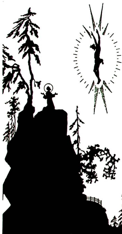
Frans av Assisi i visjon på „sitt fjell“.

Det er på en måte synd at årets minnefest for den hellige Frans' sårmerker må vike første plassen for søndagens liturgi. Men det er, tror jeg, noe som den lykkelige lille mannen selv ville ha ønsket. Selv om han sikkert ikke ville hatt noe imot å minne oss om Vår Herres lidelser, ville han vært like lykkelig om vi ikke hadde tenkt på ham i det hele tatt. Åndelig var han stor nok til å ønske å bli glemt; han var også stor nok til å tilgi oss at vi ikke glemmer ham.