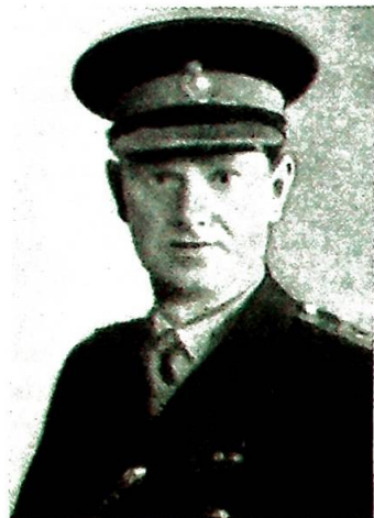
Evelyn Waugh. Verdenskjent katolsk dikter.

Jeg er født i England i 1903 og er ved arv og tradisjon sterkt knyttet til den engelske statskirke. Blant mine forfedre vrirler det med anglikanske prester. Min far var hva man kaller en solid kirkens mann, dvs. han gikk regelmessig i kirke og førte et eksemplarisk liv. Han interesserte seg ikke for teologi og heller ikke for politikk, men han ga sin stemme til Tory-partiet akkurat som hans far og beste-